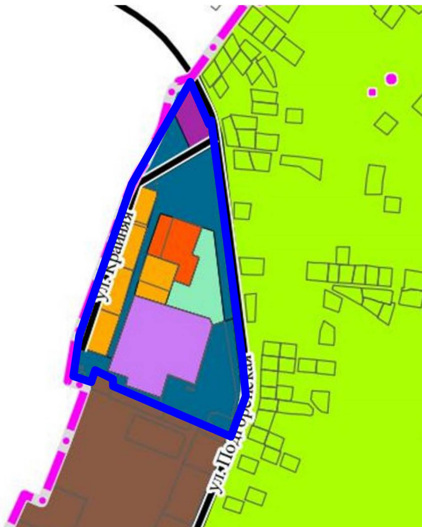
Схема границ территории для подготовки проекта межевания территории в районе улиц Крайняя, Подгоренская в городе Липецке (Подгорное)