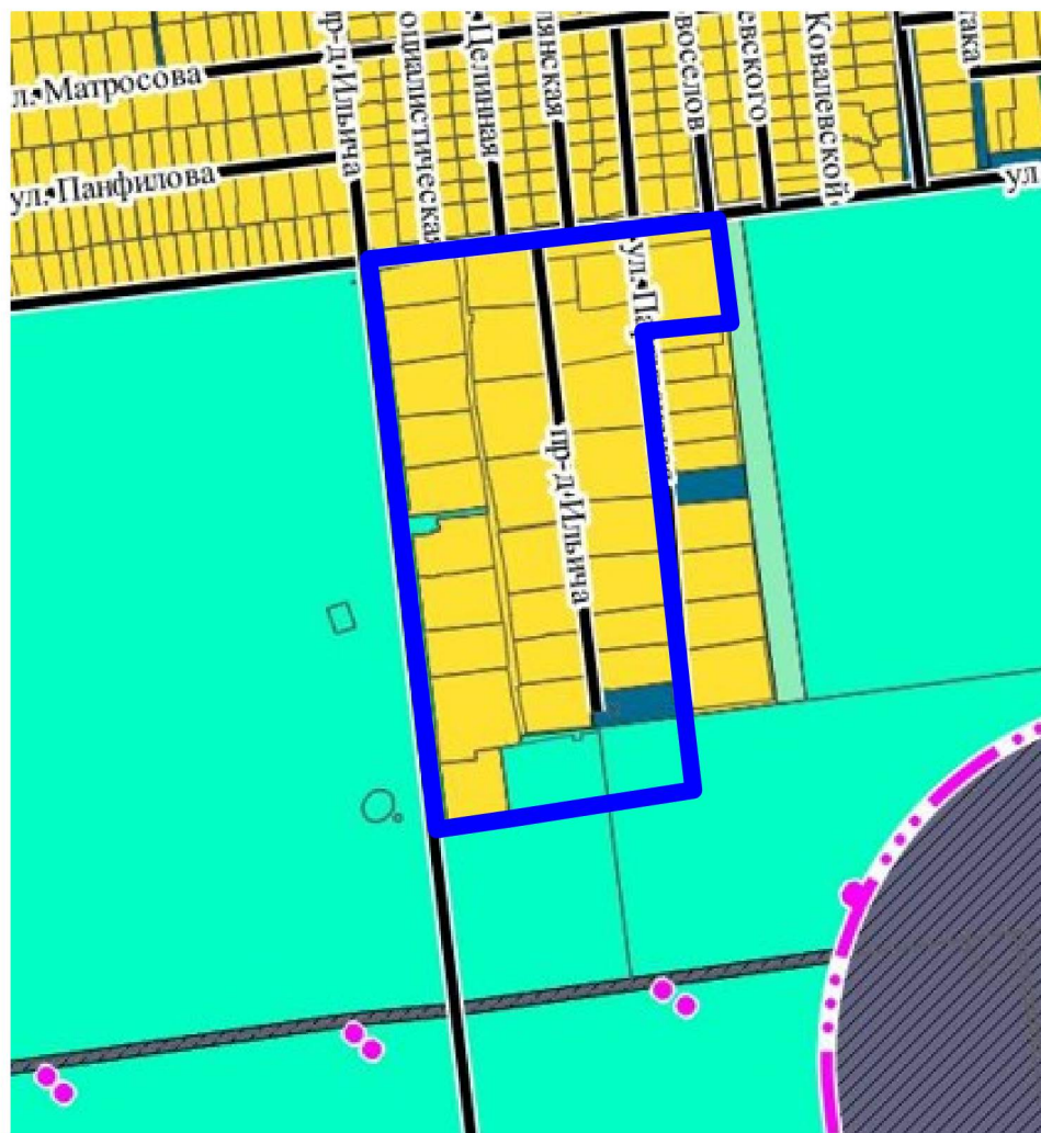
Схема границ территории для подготовки проекта межевания территории в районе улицы Докучаева и проезда Ильича в городе Липецке