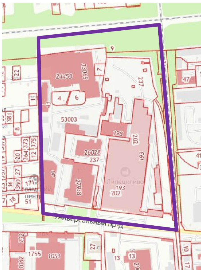
Схема границ территории для подготовки проекта межевания территории в районе проезда Универсальный в городе Липецке