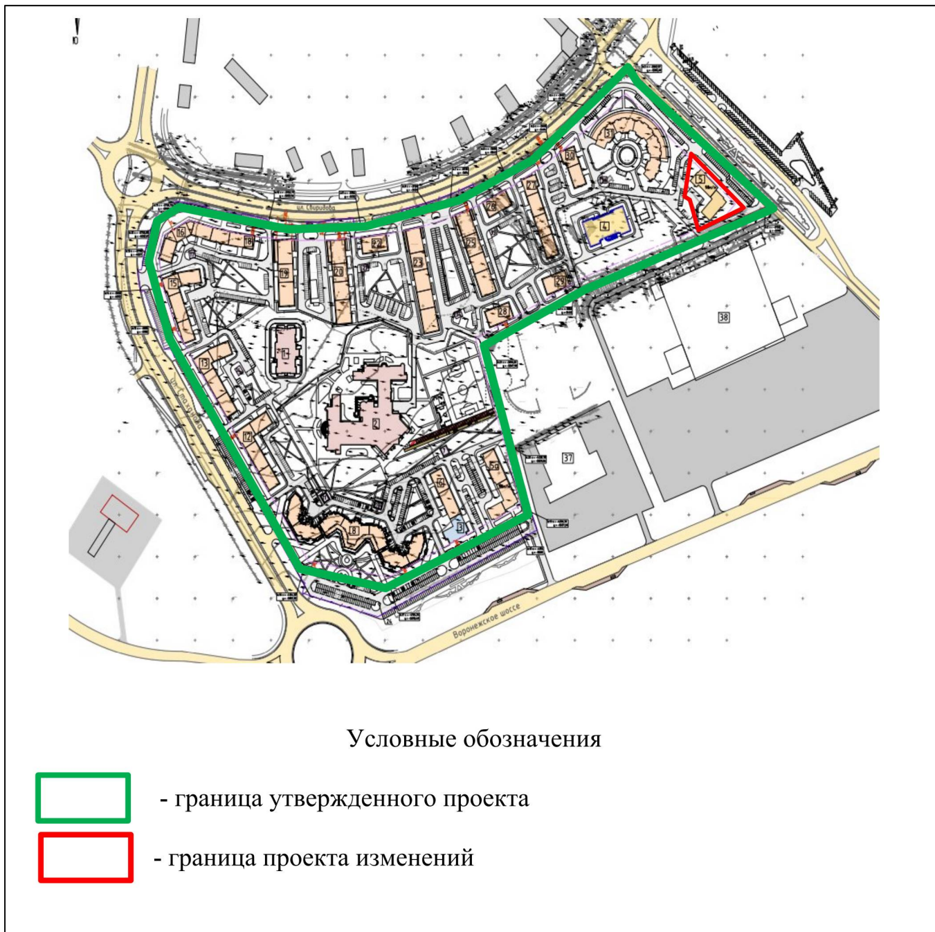
Схема границ территории для подготовки проекта изменений в проект планировки и проект межевания территории жилых микрорайонов 30-31 города Липецка, в части проекта планировки