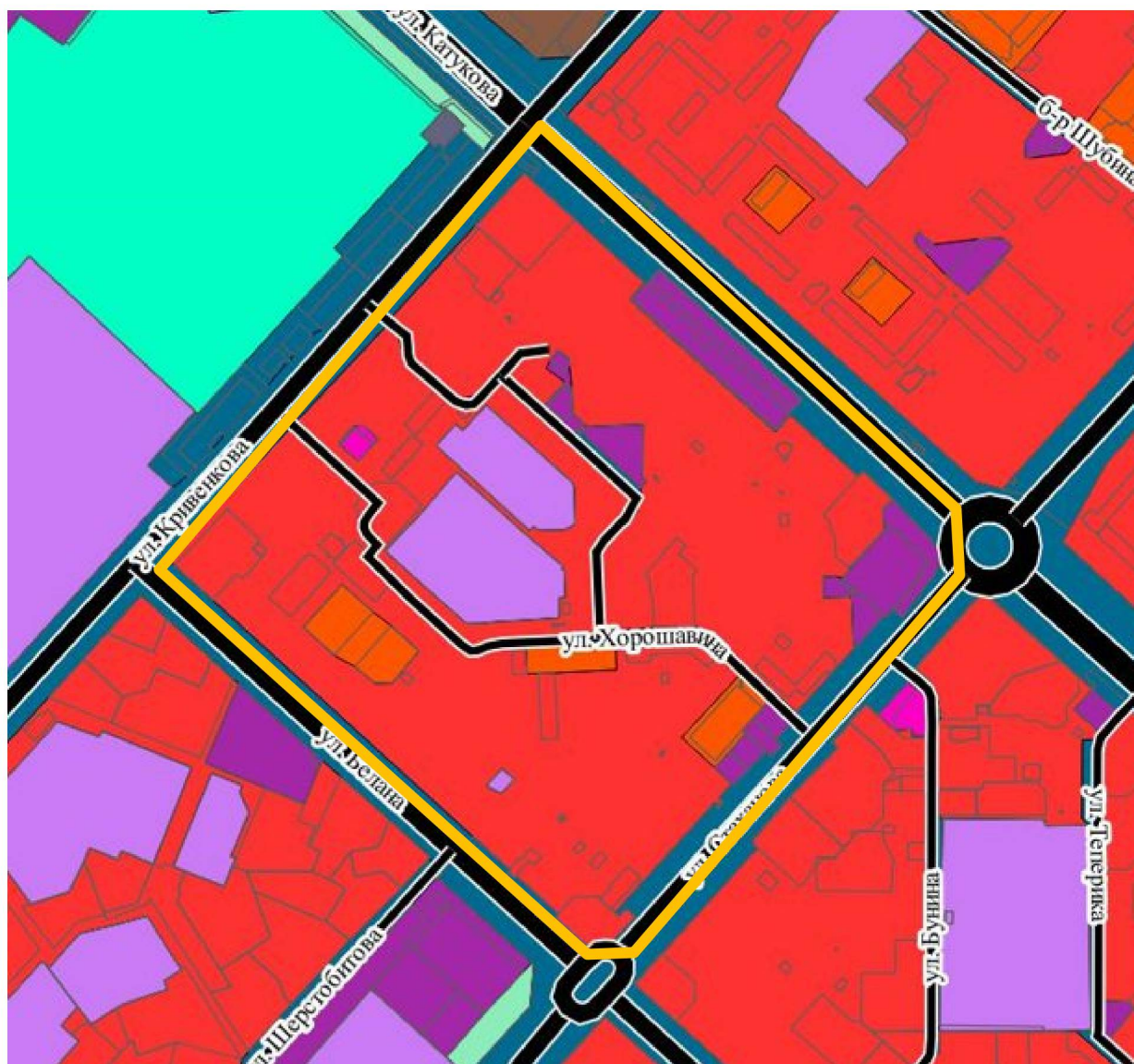
Схема границ территории для подготовки документации по планировке территории (проект планировки и проект межевания), ограниченной улицами в Катукова, А.Г. Стаханова, Героя России Эдуарда Белана, Леонтия Кривенкова в городе Липецке