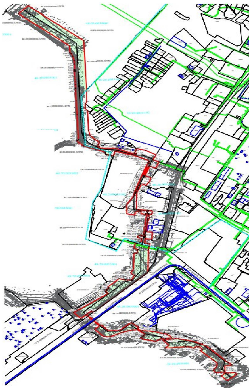
Схема границ территории для подготовки проекта изменений в проект планировки и проект межевания территории для размещения линейного объекта: «ПАО «НЛМК». ЦВС. Строительство трубопровода повторно используемой воды от насосной станции 1-го подъема № 3 до района старого заводоуправления с подключением к существующему трубопроводу подпиточной воды»