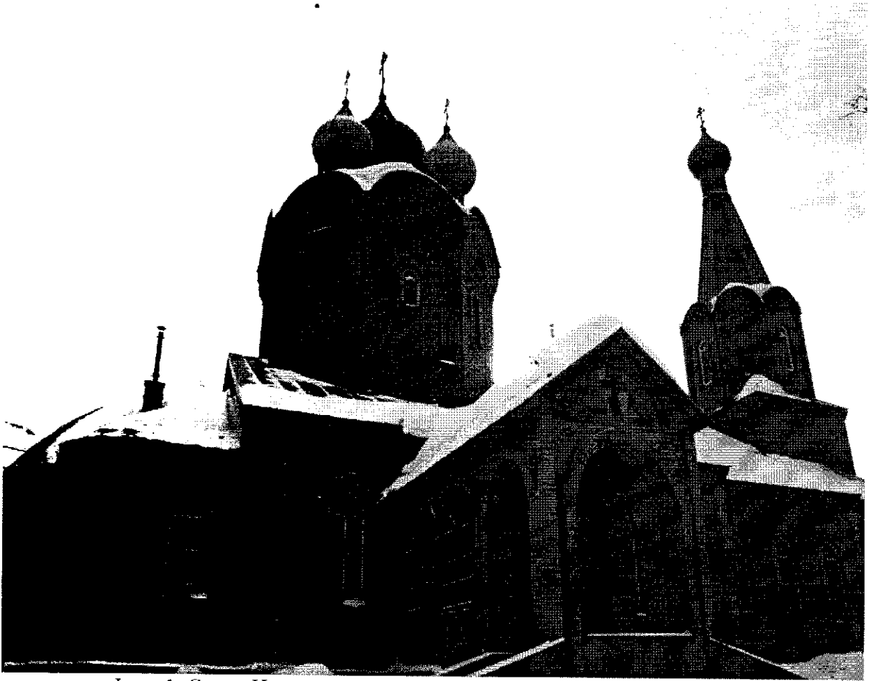
Фото 1. Свято-Никольский Кафедральный Собор, вид на юго-запад