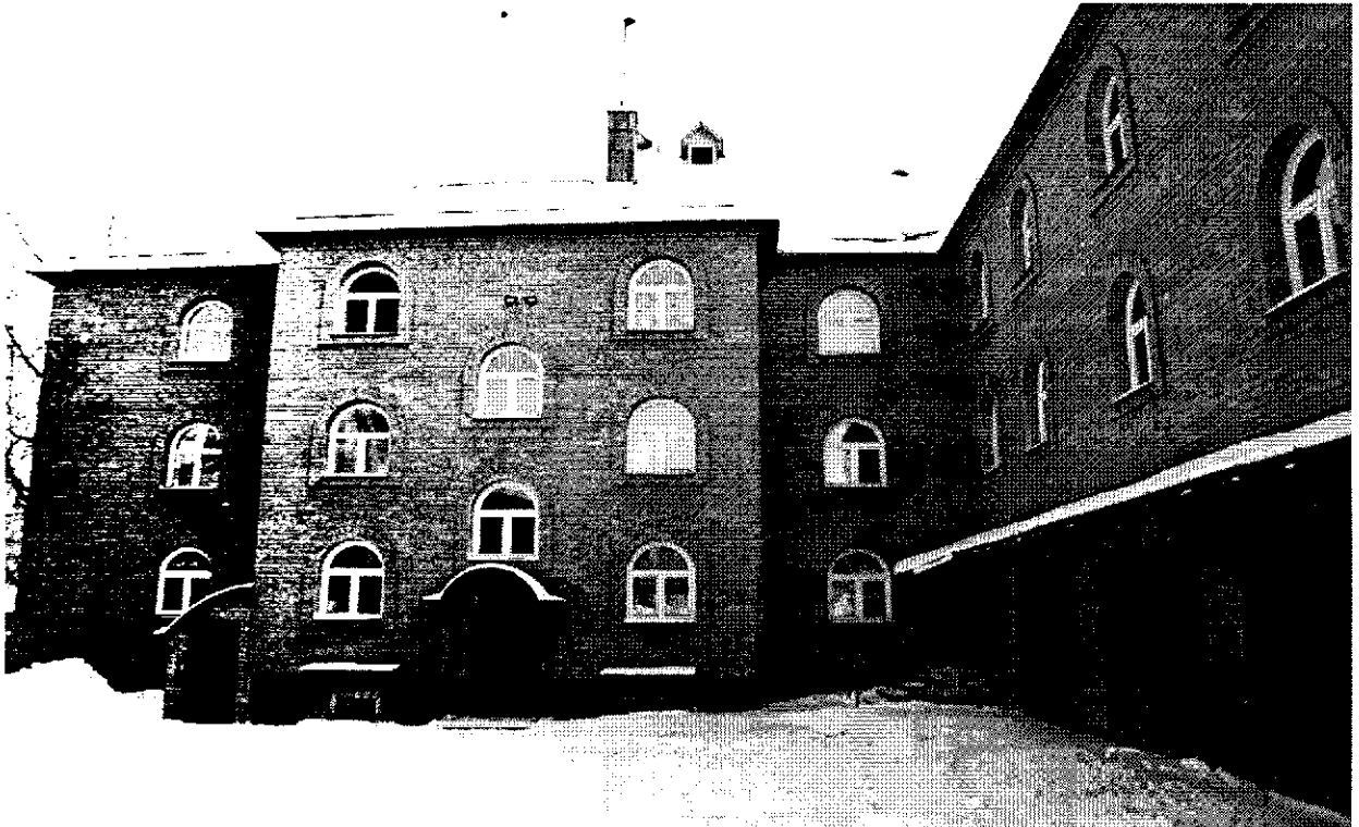
Фото 3. Общий вид 3-х этажного здания хозяйственного назначения. Вид на северо-восток