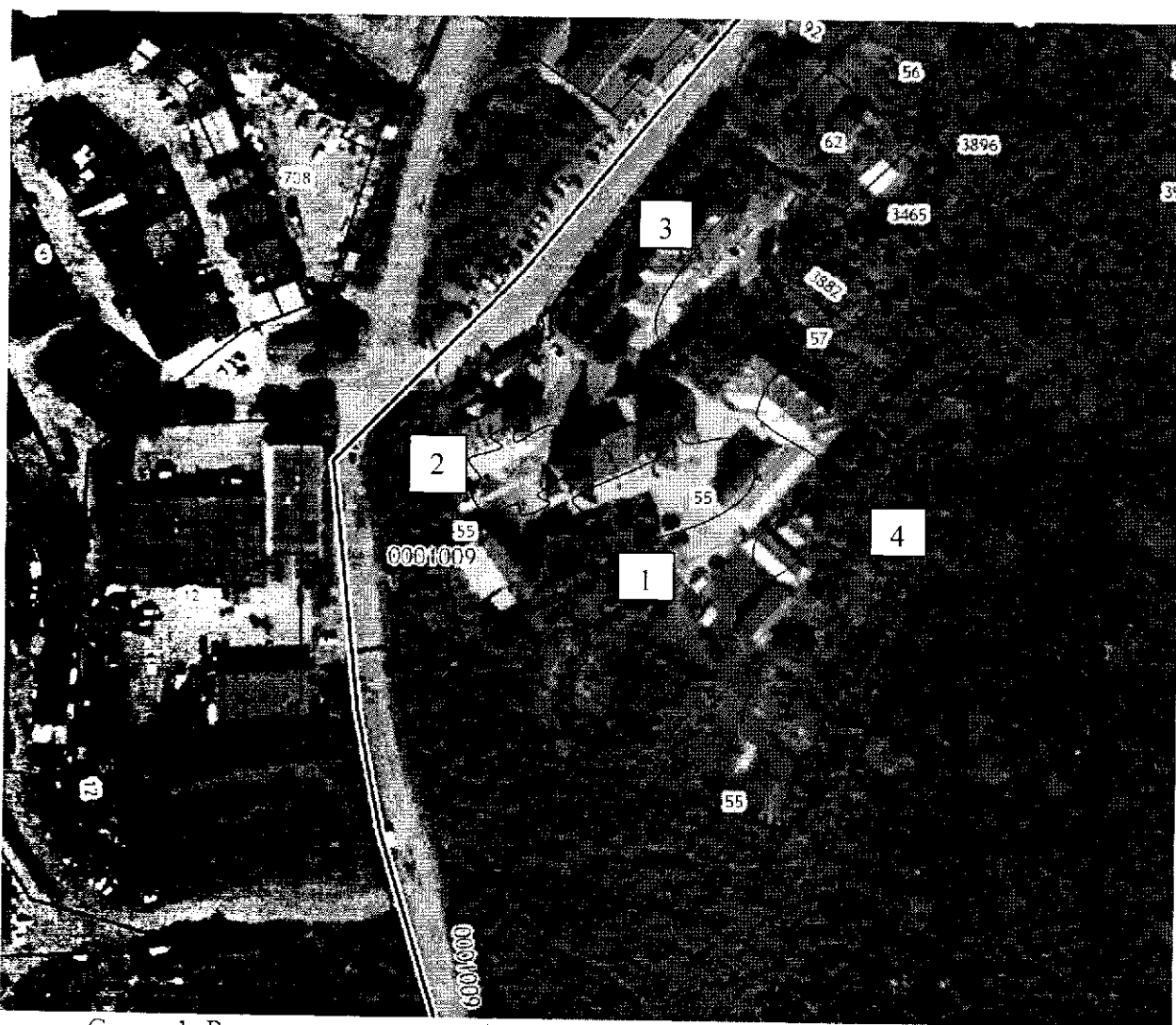
Схема 1. Расположение ансамбля в планировочной структуре города Мурманска

Расположение элементов ансамбля на земельном участке 51:20:0001009:55: