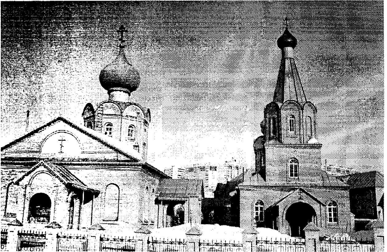
Фото 5. Вид на Свято-Никольский Кафедральный Собор и Храм Трифона-Печенгского. 1996 г. Вид с улицы Зелёной. Направление съемки: северо-восток