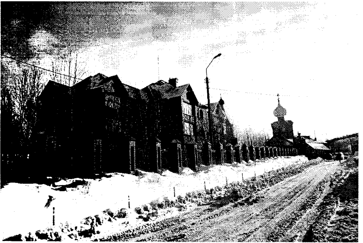
Фото 6. Вид на Ансамбль с улицы Зелёной. Направление съемки: юго-запад