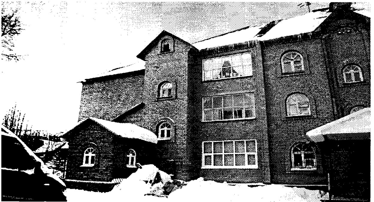
Фото 4. Общий вид 3-х этажного жилого дома. Вид на северо-запад