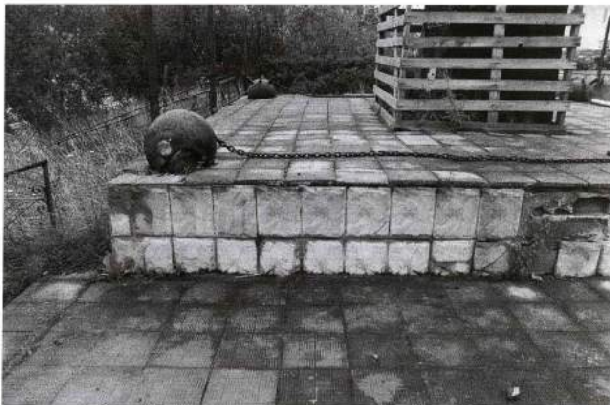
Фото 4. Вид на постамент памятника с запада. Дата: 2020 год.