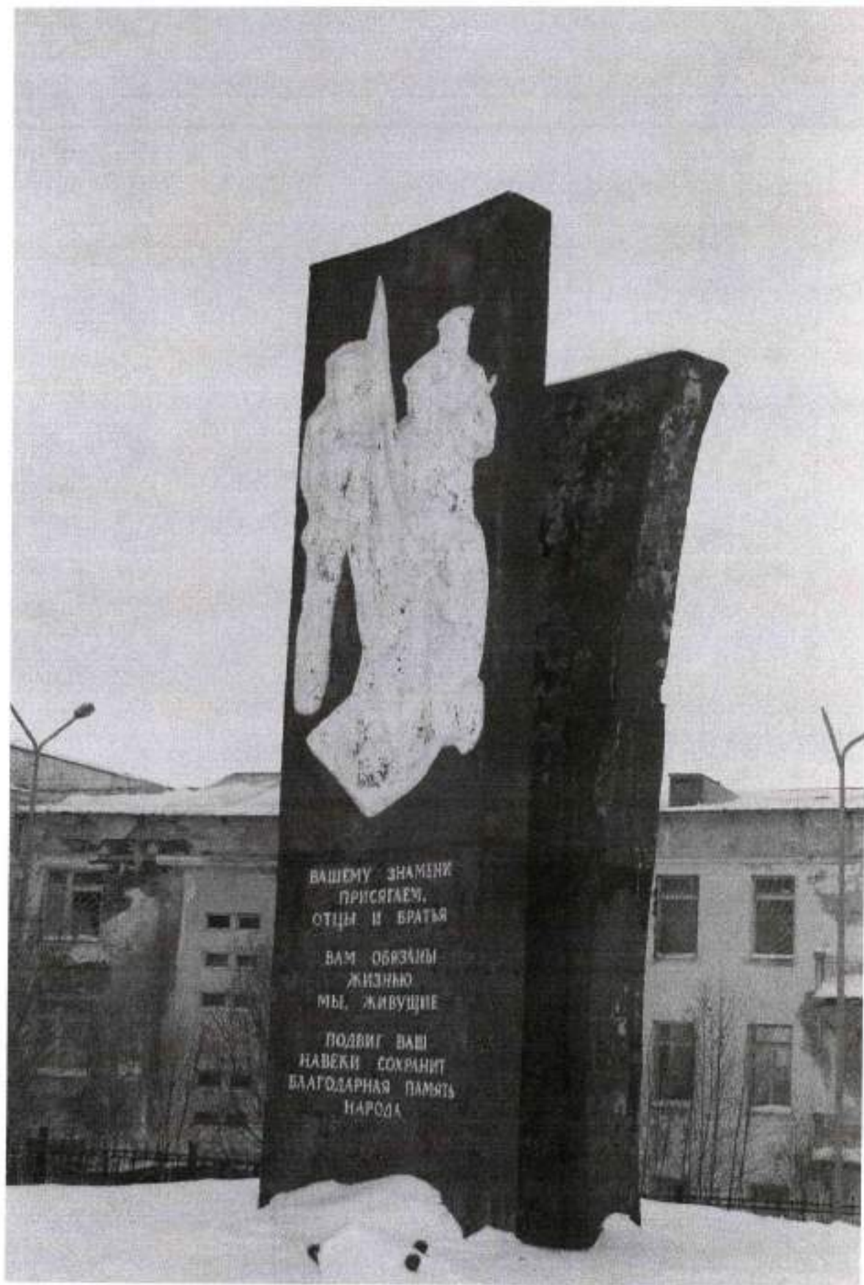
Фото 5. Вид на стелы памятника с юго-востока. Дата: 2015 г.