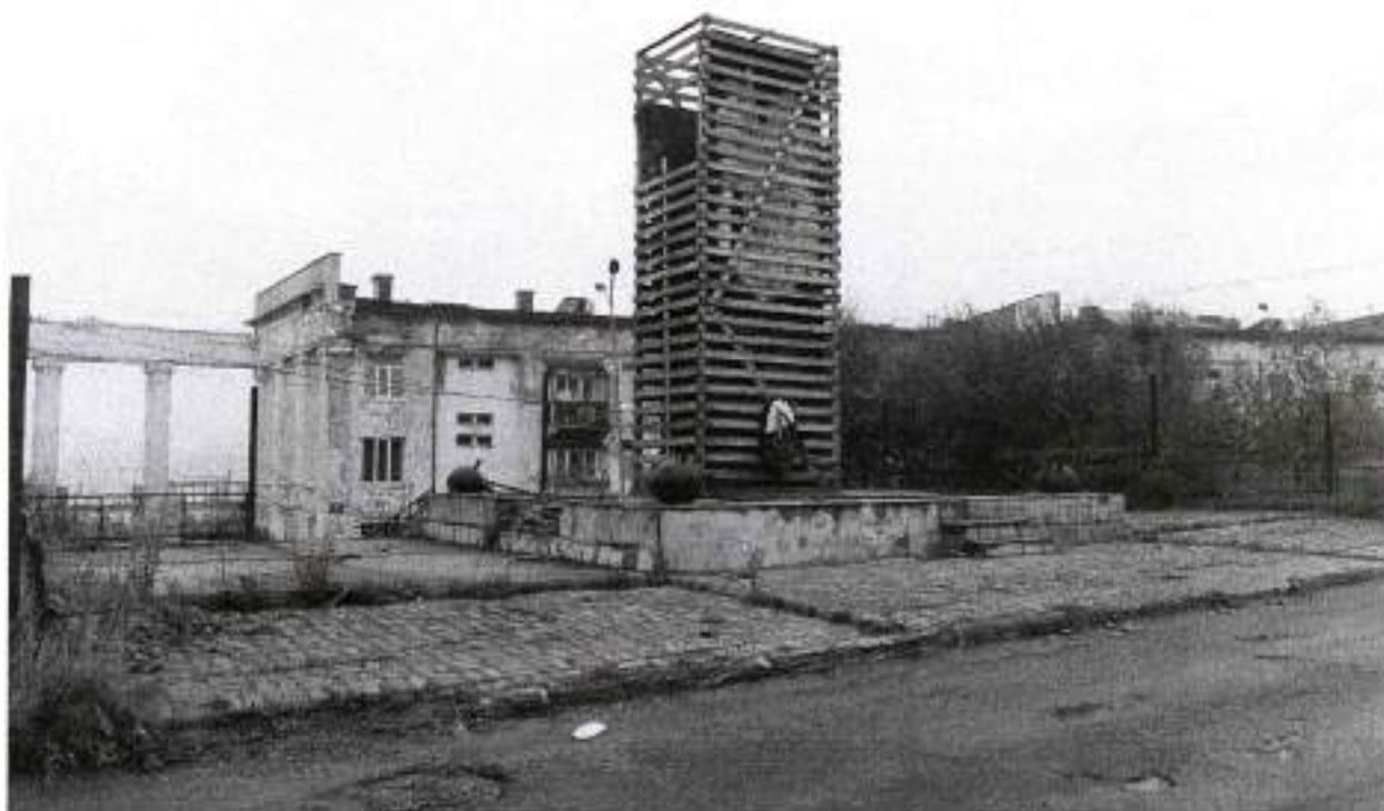
Фото 1. Вид на паметник с југо-запада. Дата: 2020 г.