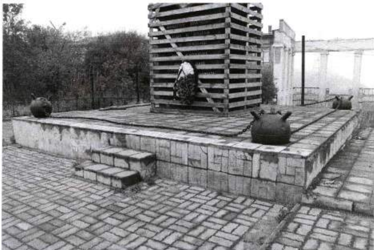
Фото 3. Вид на постамент памятника с юго-востока. Дата: 2020 г.