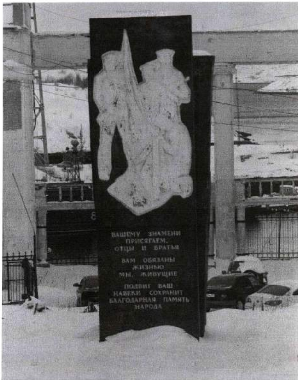
Фото 8. Вид на южную стелу с юга. Дата: 2015 г.