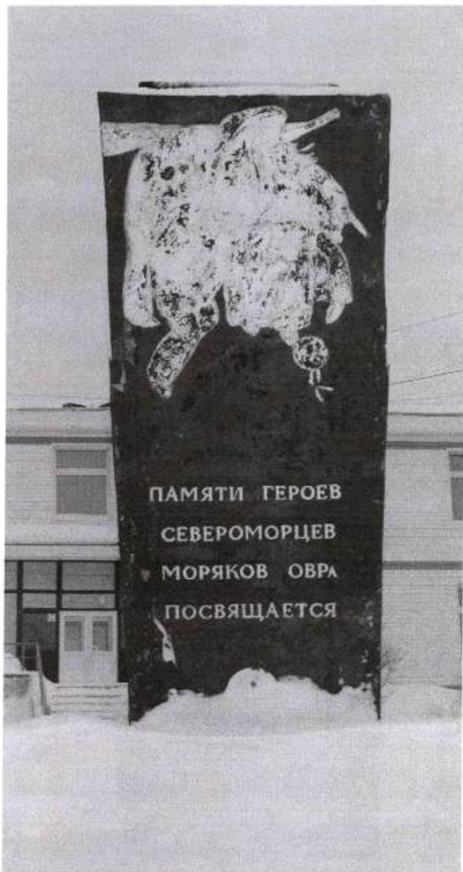
Фото 6. Вид на северную стелу памятника с севера. Дата: 2015 г.