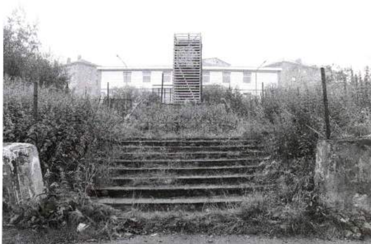
Фото 2. Вид на паметник с севера. Дата: 2020 г.