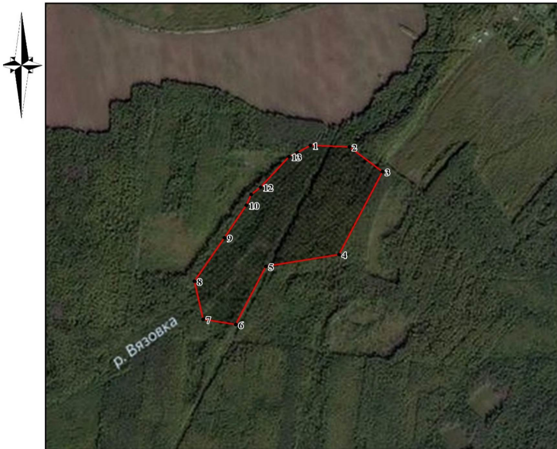
СХЕМА ГРАНИЦ ПАМЯТНИКА ПРИРОДЫ РЕГИОНАЛЬНОГО ЗНАЧЕНИЯ "УЧАСТОК ЛЕСА С ПИХТОЙ СИБИРСКОЙ В КОВРОВСКОМ УЧАСТКОВОМ ЛЕСНИЧЕСТВЕ БОРСКОГО РАЙОННОГО ЛЕСНИЧЕСТВА"