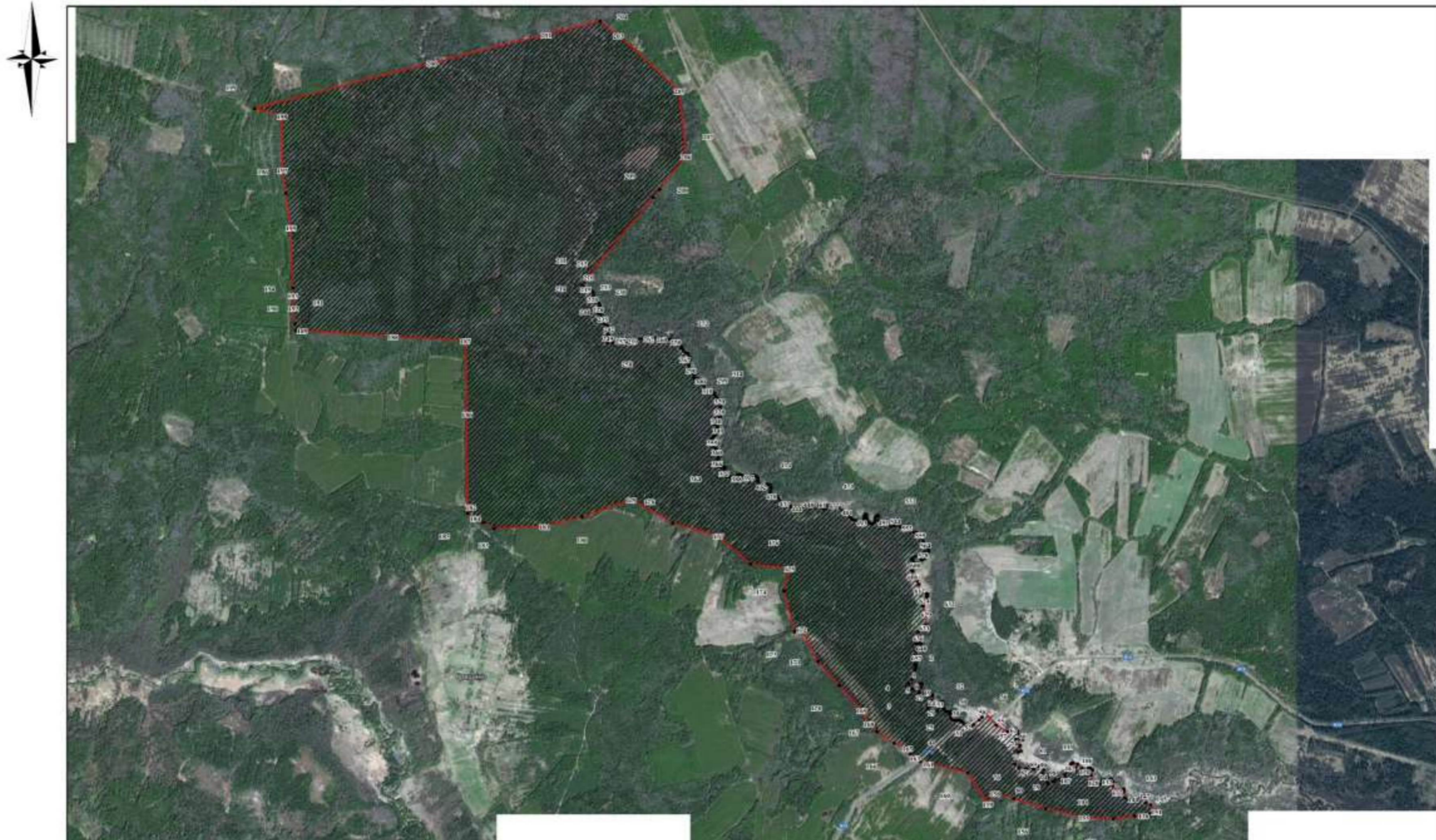
СХЕМА ГРАНИЦ ПАМЯТНИКА ПРИРОДЫ РЕГИОНАЛЬНОГО ЗНАЧЕНИЯ "МАССИВ ПИХТОВО-ЕЛОВОГО ЛЕСА ПО РЕКЕ ВАРВАЖ"