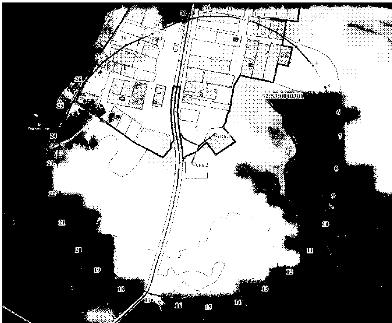
Координаты характерных точек границы территории третьего пояса ЗСО скважин № 1/71147 и № 2/71148 АО «Выксунский Водоканал» в п. Бакин г.о.г. Выкса Нижегородской области