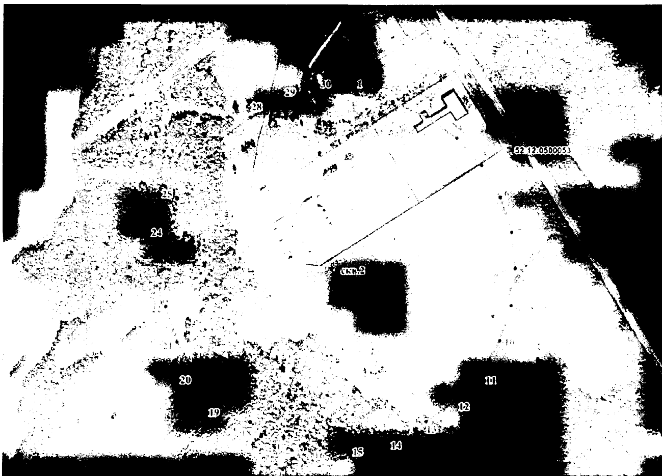
Координаты характерных точек границы третьего пояса ЗСО водозаборной скважины ООО «НШПЗ»

2.2. Граница третьего пояса ЗСО водозаборной скважины ООО «НШПЗ» устанавливается в форме окружности радиусом 306,0 м от оси скважины.