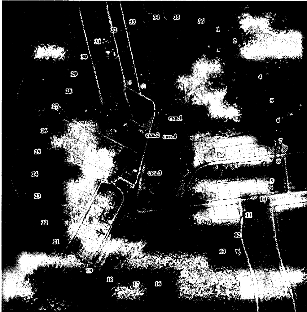
Координаты характерных точек границ третьего пояса ЗСО скважин № 1-4

Границы третьих поясов ЗСО определены гидродинамическими расчетами и имеют в плане форму пересекающихся окружностей радиусами: 248,0 метров у скважины № 1; 248,0 метров у скважины № 2; 273,0 метра у скважины № 3; 254,0 метра у скважины № 4. Для скважин №№ 1,2,3,4 границы третьего пояса общие.