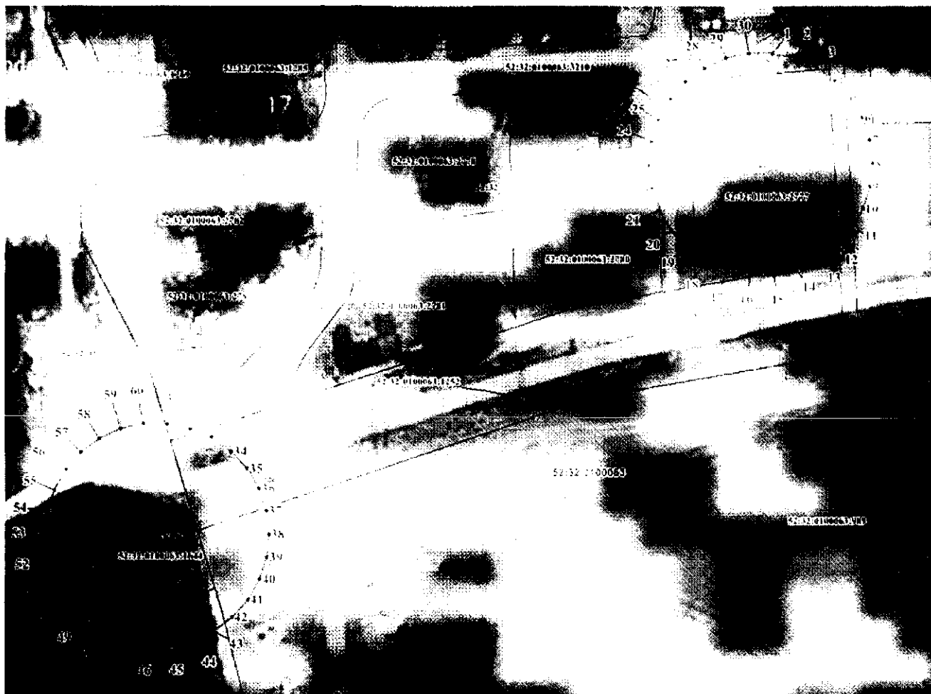
Координаты характерных точек границ вторых поясов ЗСО скважин № 1 и № 2 ТСН «Серебряные ключи»