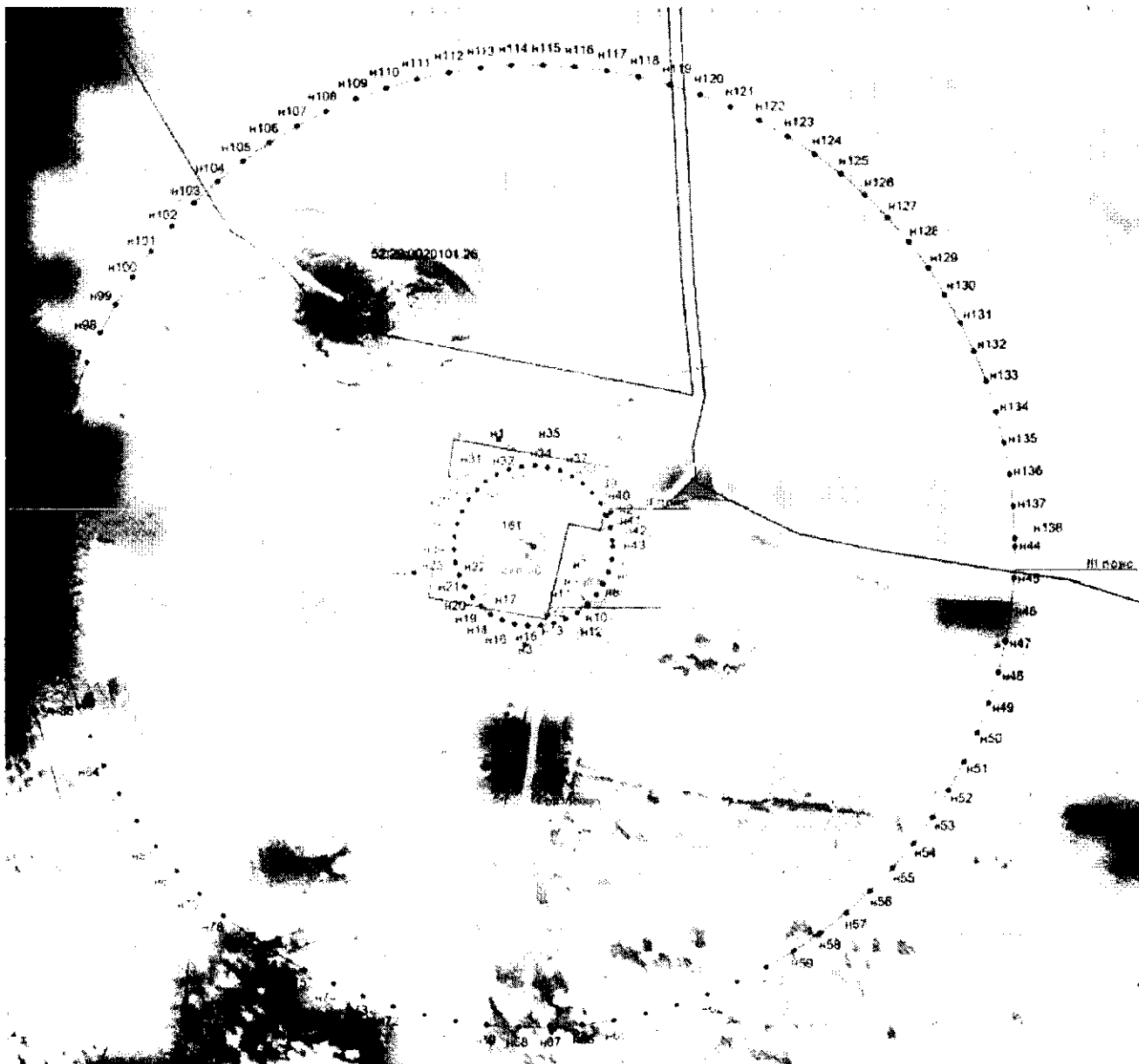
Координаты характерных точек границ первого, второго, третьего поясов ЗСО скважины № 30