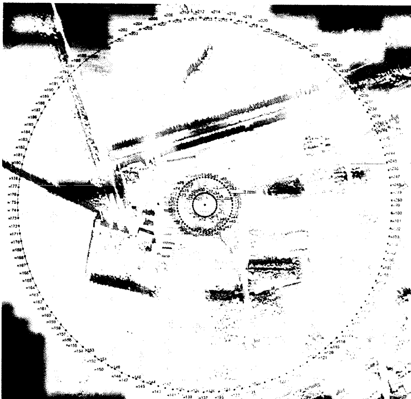
Координаты характерных точек границ первого, второго, третьего поясов ЗСО скважины № 27