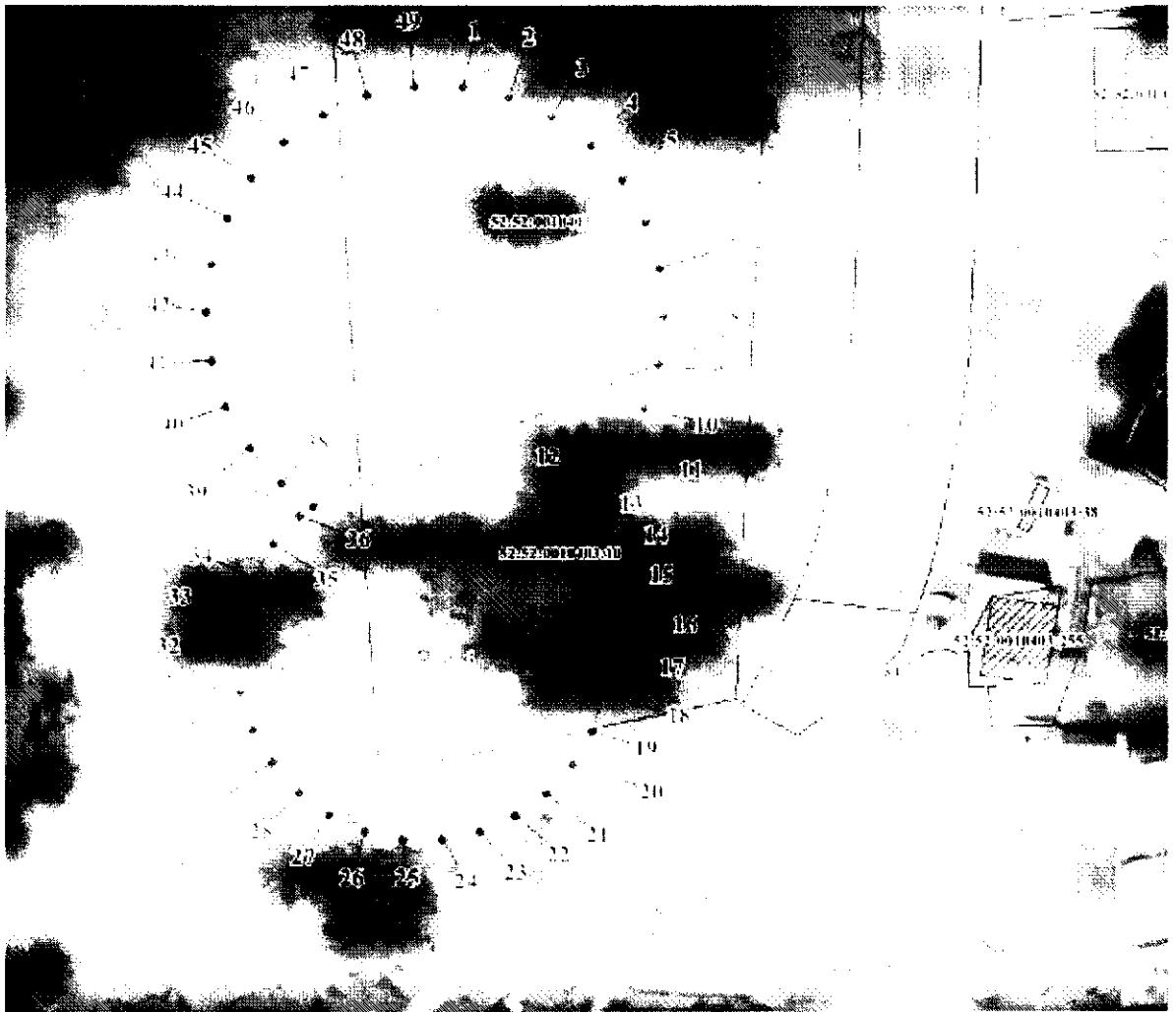
Координаты характерных точек границы второго пояса ЗСО водозаборного участка АО «Выксунский Водоканал»