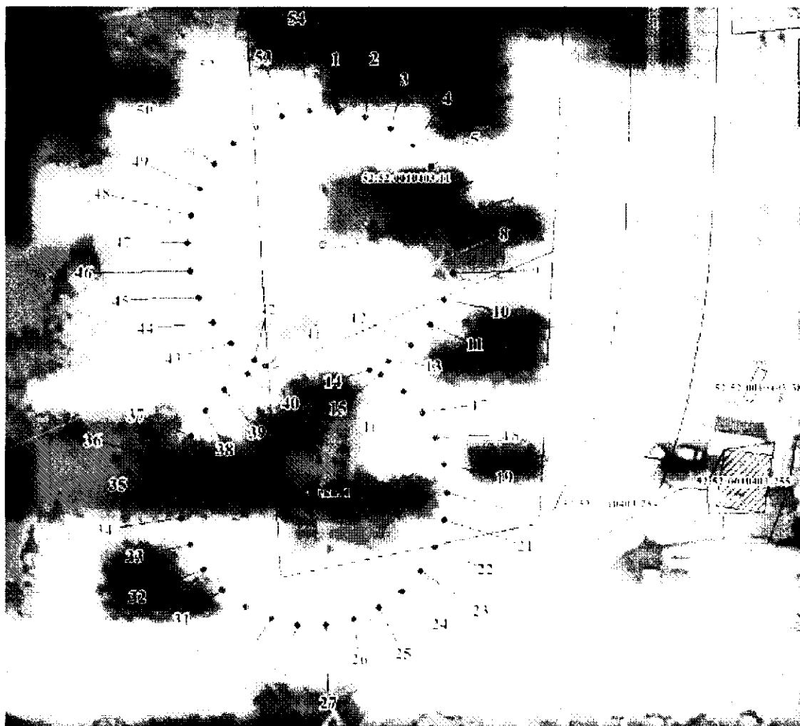
Координаты характерных точек границы первого пояса ЗСО водозаборного участка АО «Выксунский Водоканал»