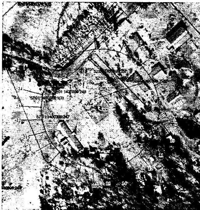
Координаты характерных точек границ второго пояса ЗСО для водозаборного участка

Границы второго пояса ЗСО скважины определены в результате гидродинамических расчетов, имеет форму окружности. По расчетам размеры второго пояса ЗСО составляют 76,0 м.