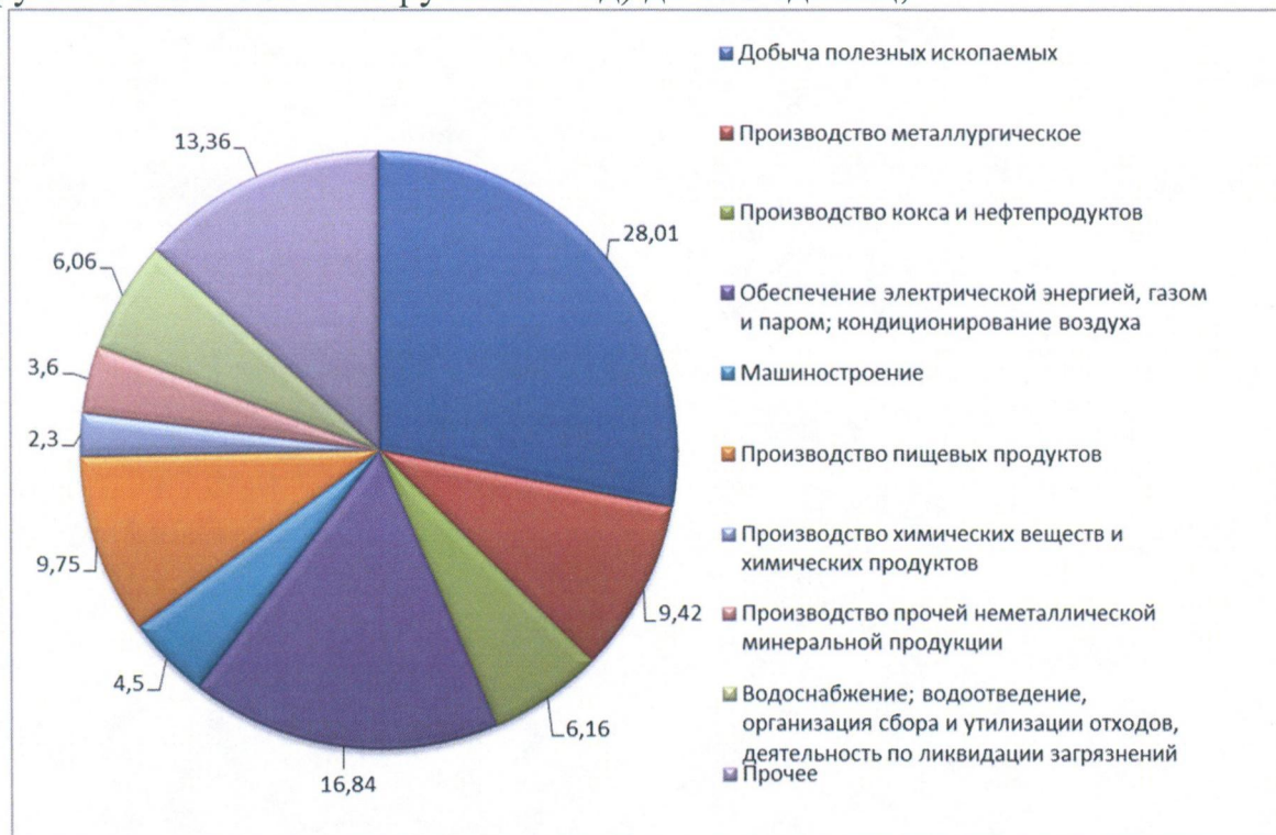
Рисунок 1. Долевое распределение промышленной продукции по отраслям в 2021 году

увеличение количества предприятий обрабатывающей промышленности (с выручкой более 300 млн. рублей в год) до 150 единиц;