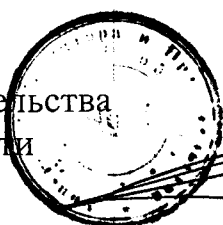
В. В. Потомский

Председатель Правительства Орловской области