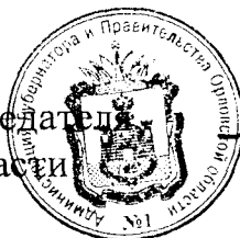
А. Ю. Бударин

Исполняющий обязанности Председателя Правительства Орловской области