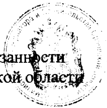
А. Ю. Бударин

Исполняющий обязанности Губернатора Орловской области