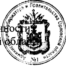
А. Ю. Бударин

Исполняющий обязанности Губернатора Орловской области