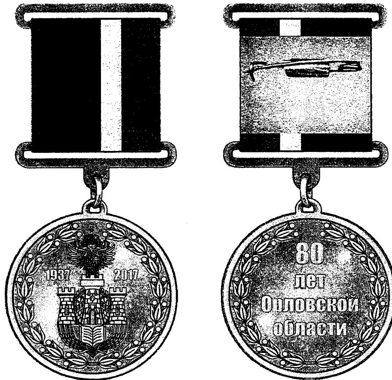
Рисунок юбилейного знака «80 лет Орловской области»