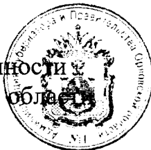
А. Ю. Бударин

Исполняющий обязанности Губернатора Орловской области