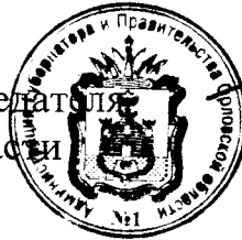
А. Ю. Бударин

Исполняющий обязанности Председателя Правительства Орловской области