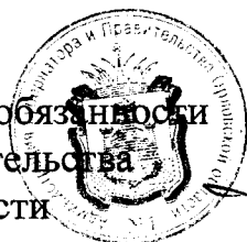
А. Е. Клычков

Временно исполняющий обязанности Председателя Правительства Орловской области