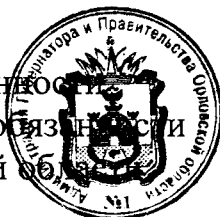
А. Ю. Бударин

Исполняющий обязанности временного исполняющего обязанности Губернатора Орловской области