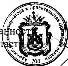
А. Е. Клычков

Временно исполняющий обязанности Губернатора Орловской области