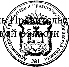
А. Е. Клычков

Председатель Правительства Орловской области