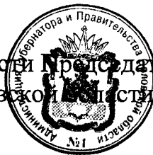
В. А. Тарасов

Исполняющий обязанности Председателя Правительства Орловской области