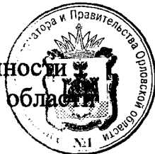
Т. В. Крымова

Исполняющий обязанности Губернатора Орловской области