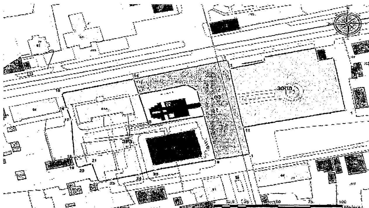
Схема границ зон охраны объекта культурного наследия