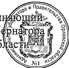
В. А. Тарасов

Временно исполняющий обязанности Губернатора Орловской области