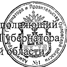
В. А. Тарасов

Временно исполняющий обязанности Губернатора Орловской области