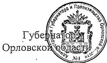
А. Е. Клычков

«б) копия положительного заключения государственной экспертизы проектной документации и (или) проверки достоверности определения сметной стоимости объекта строительства, реконструкции, капитального ремонта и ремонта автомобильных дорог общего пользования местного значения и искусственных сооружений на них (в случае если предоставлены субсидии на проектирование строительства, реконструкции, капитального ремонта и ремонта автомобильных дорог общего пользования местного значения и искусственных сооружений на них).».