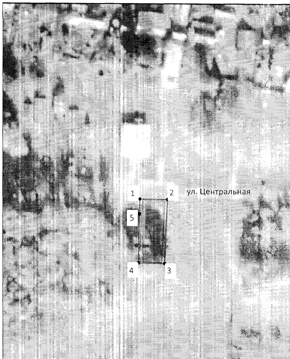
Схема границ территории объекта культурного наследия