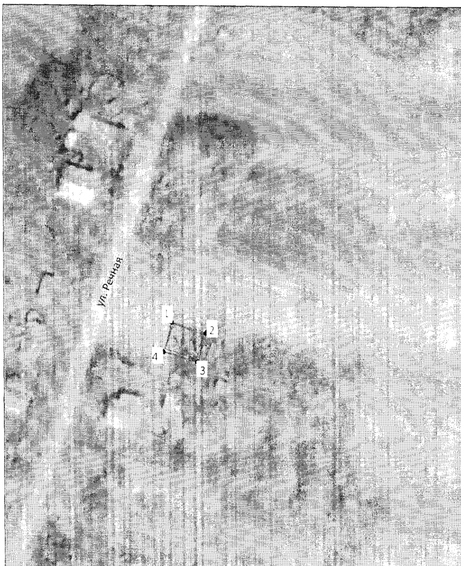
Схема границ территории объекта культурного наследия: