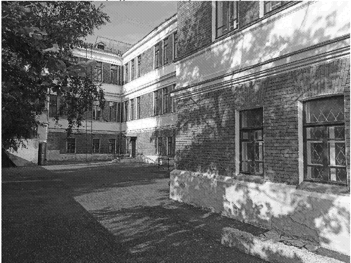
Вид на объект культурного наследия юго-западной стороны. Дворовый фасад (03.08.2021)