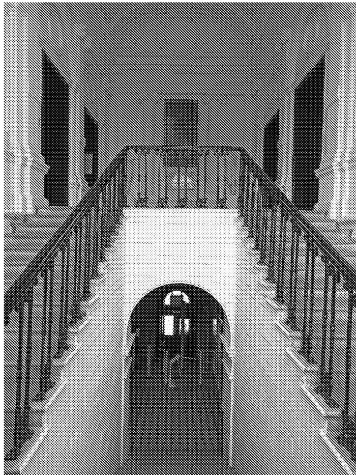
Фото бстонной лестницы, ведущей на второй этаж (03.08.2021)