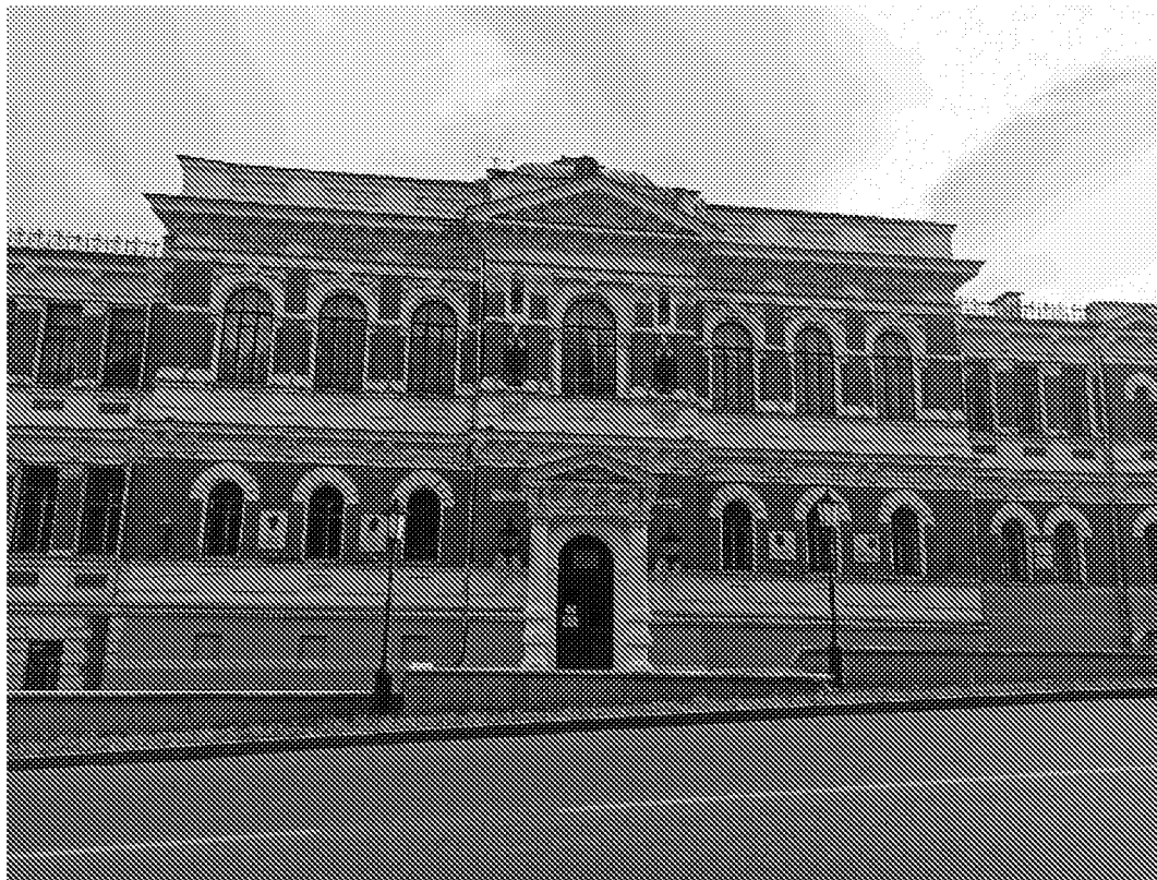
Вид на объект культурного наследия с северной стороны. Главный фасад. (03.08.2021)