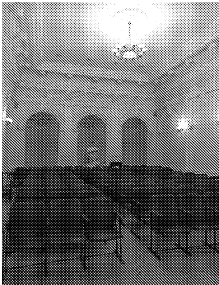
Актовый зал (03.08.2021)