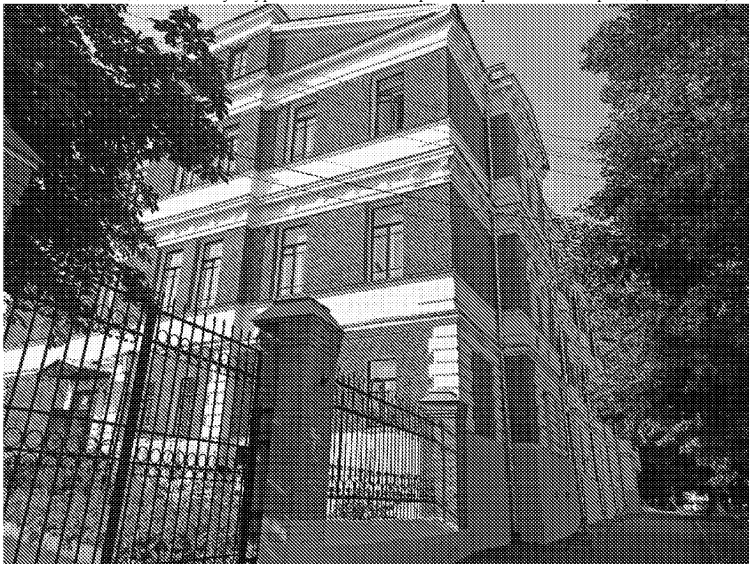
Вид на объект культурного наследия с юго-восточной стороны (03.08.2021)