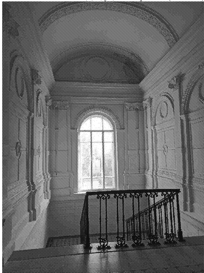
Фрагменты интерьера второго этажа (03.08.2021)