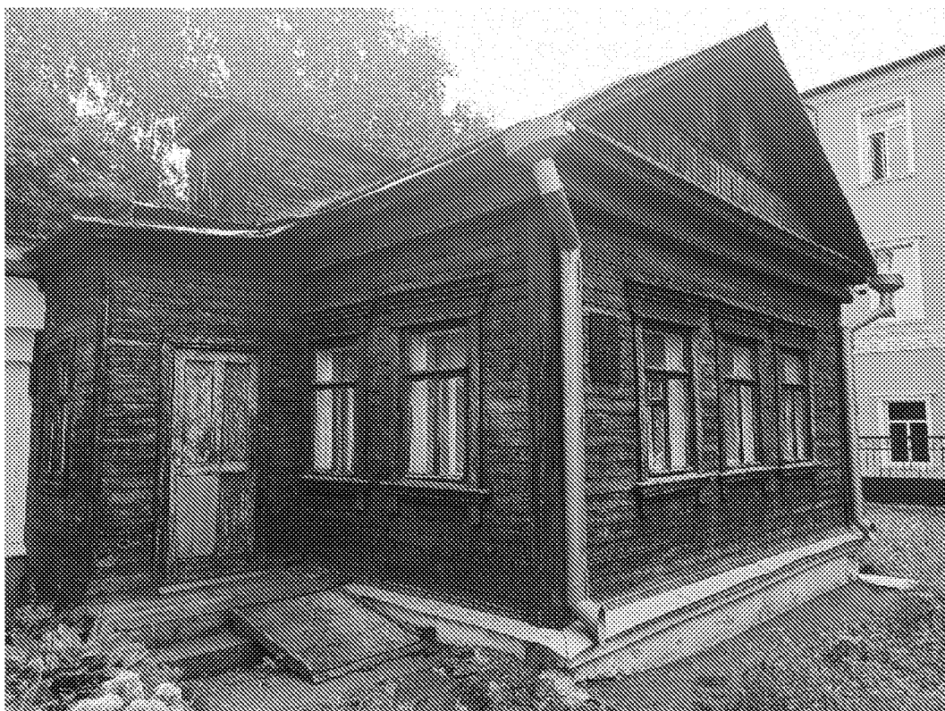
Вид на объект культурного наследия с северо- западной стороны