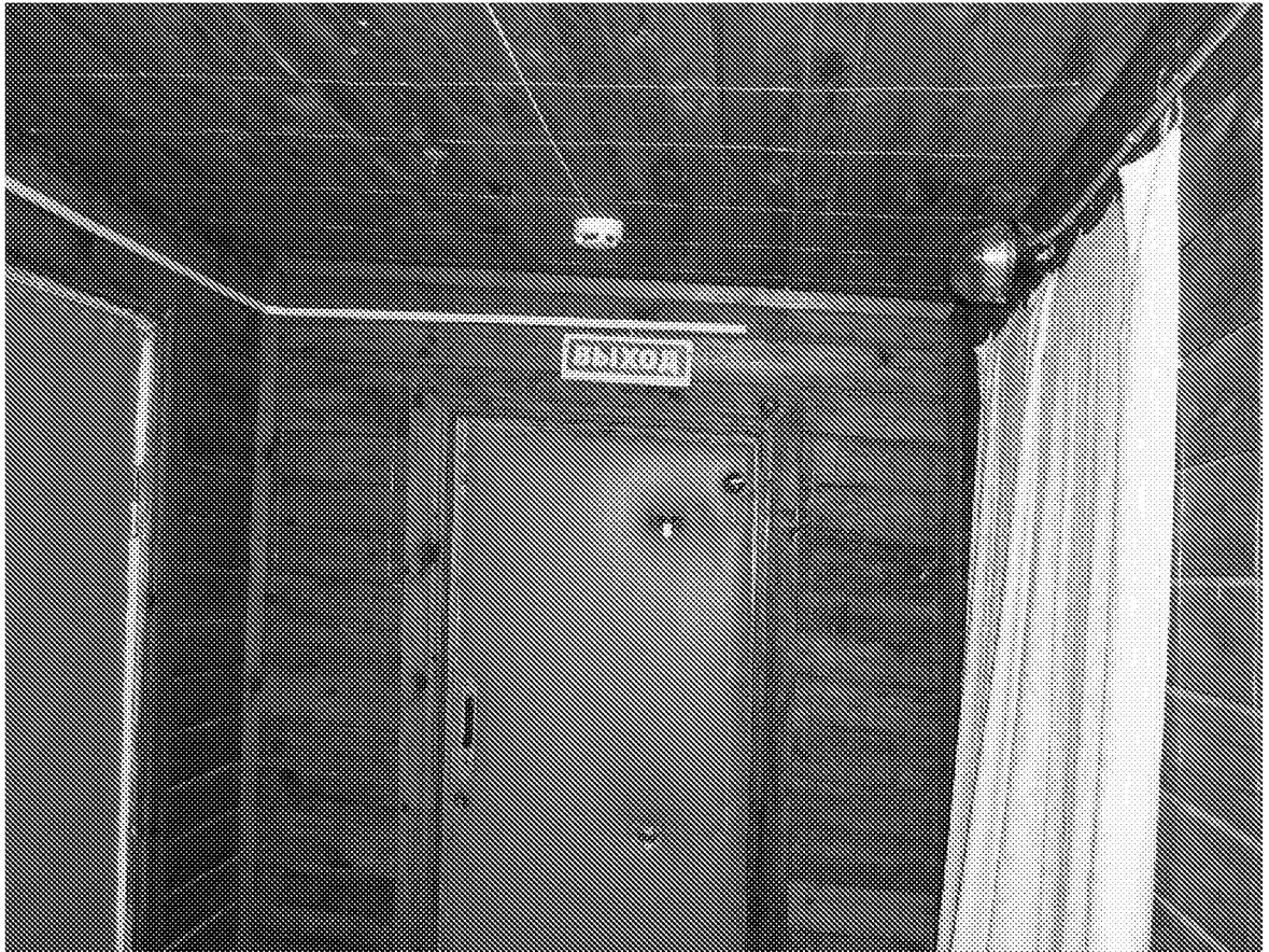
Вид помещения при входе в музей