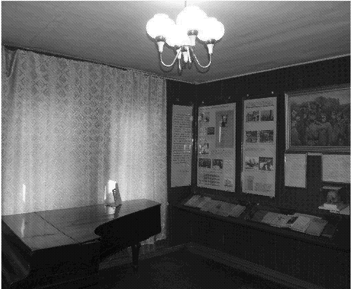
Вид помещения в здании музея