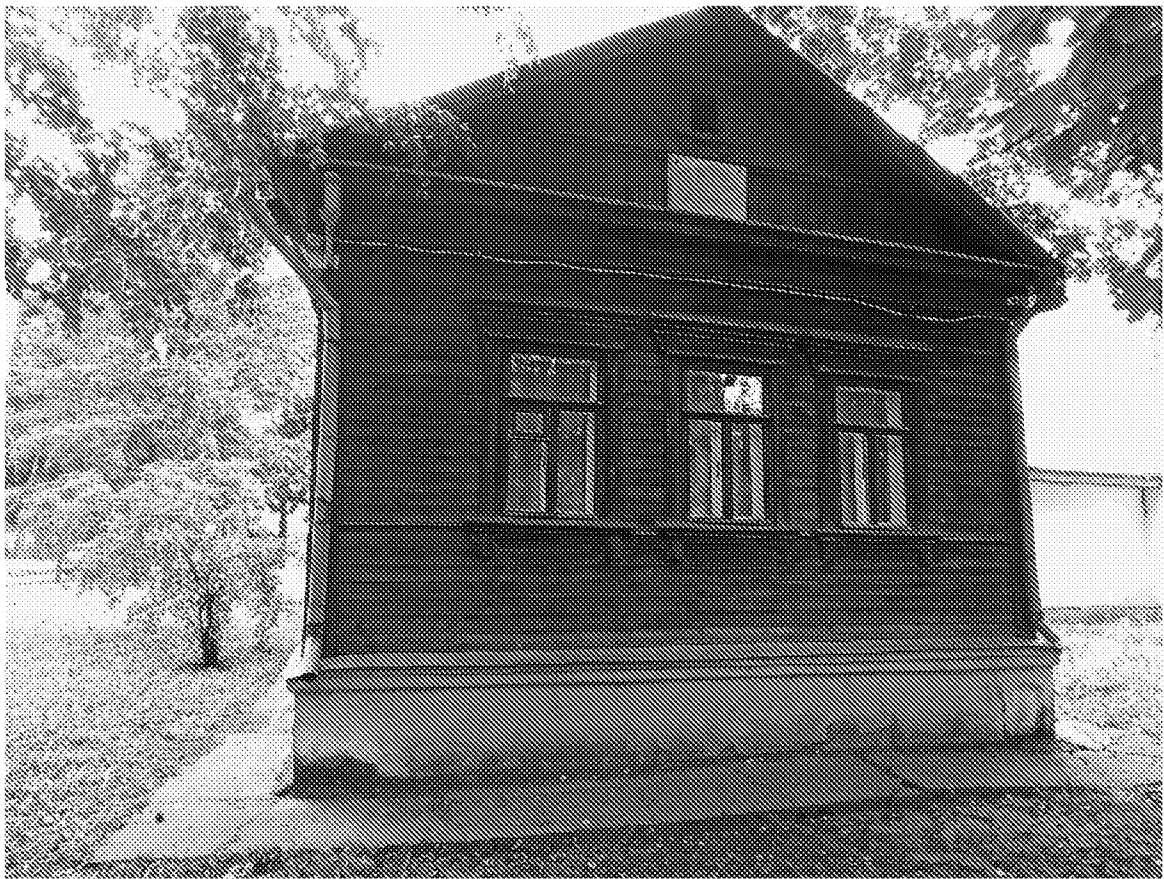
Вид на объект культурного наследия с восточной стороны