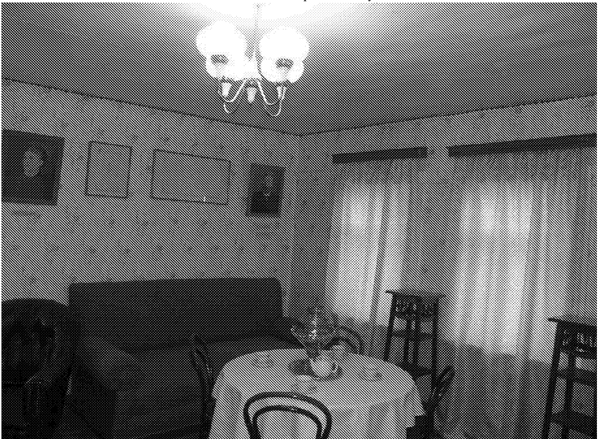
Вид помещения в здании музея