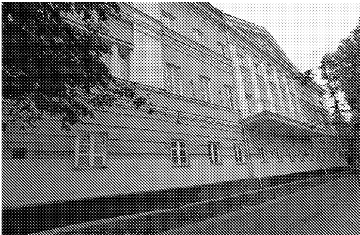
Вид на объект культурного наследия с юго-восточной стороны