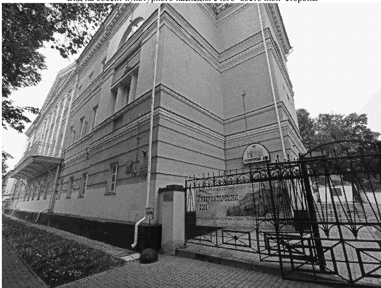
Вид на объект культурного наследия с северо-восточной стороны