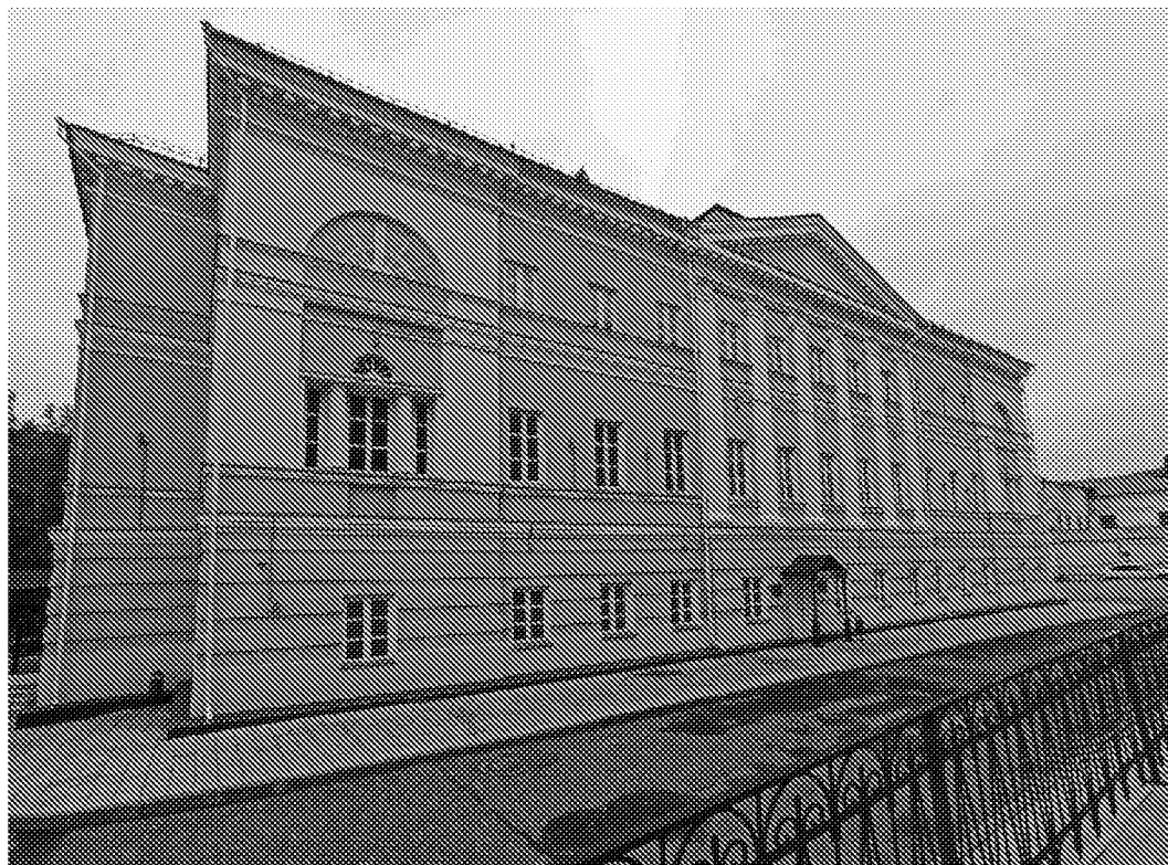
Вид на объект культурного наследия с северо- западной стороны