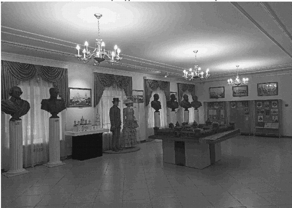
Вид помещения в здании музея