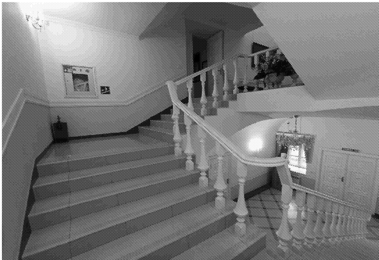
Фрагмент лестницы, ведущей на второй этаж