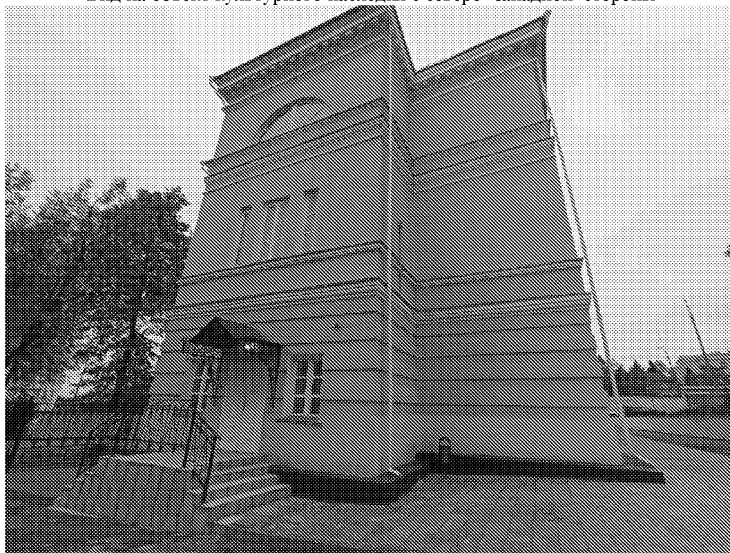
Вид на объект культурного наследия с северной стороны