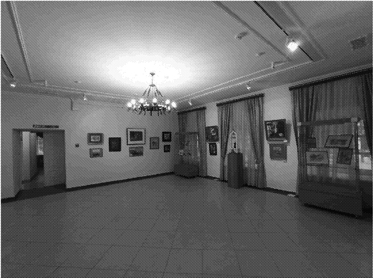
Вид помещения в здании музея