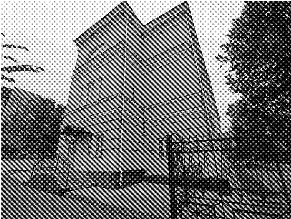
Вид на объект культурного наследия с южной стороны