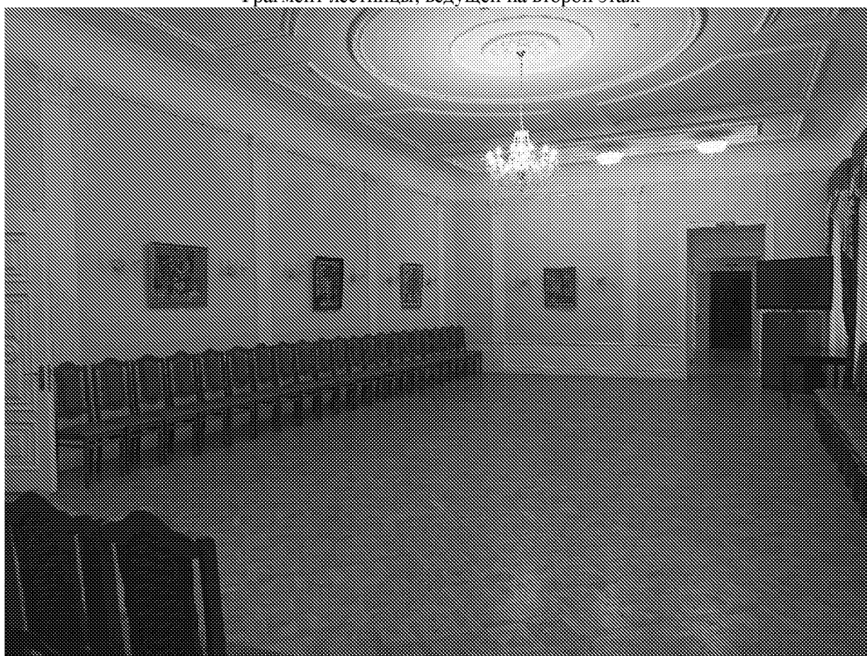
Вид помещения в здании музея