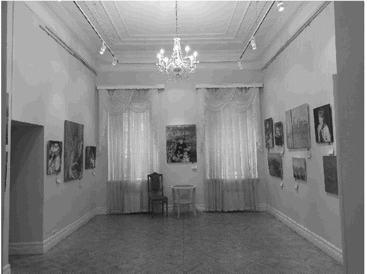
Вид помещения в здании музея