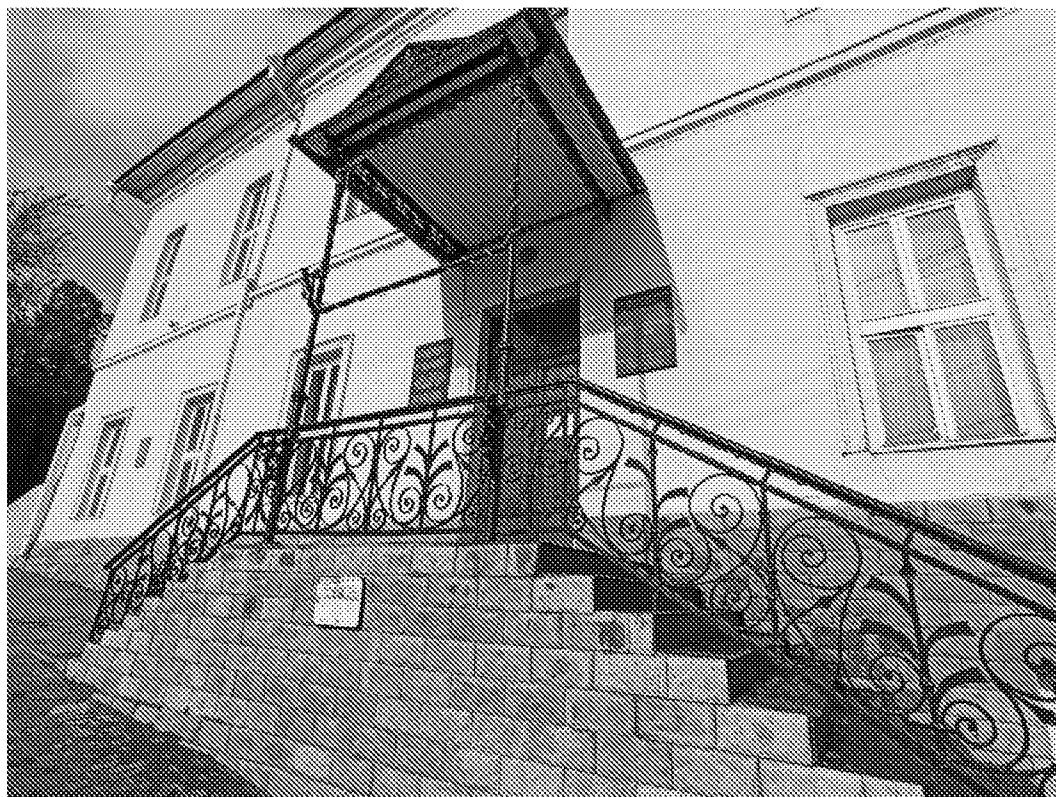
Вид на объект культурного наследия с юго - восточной стороны. Главный фасад