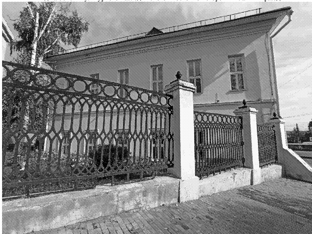
Вид на объект культурного наследия с юго - западной стороны