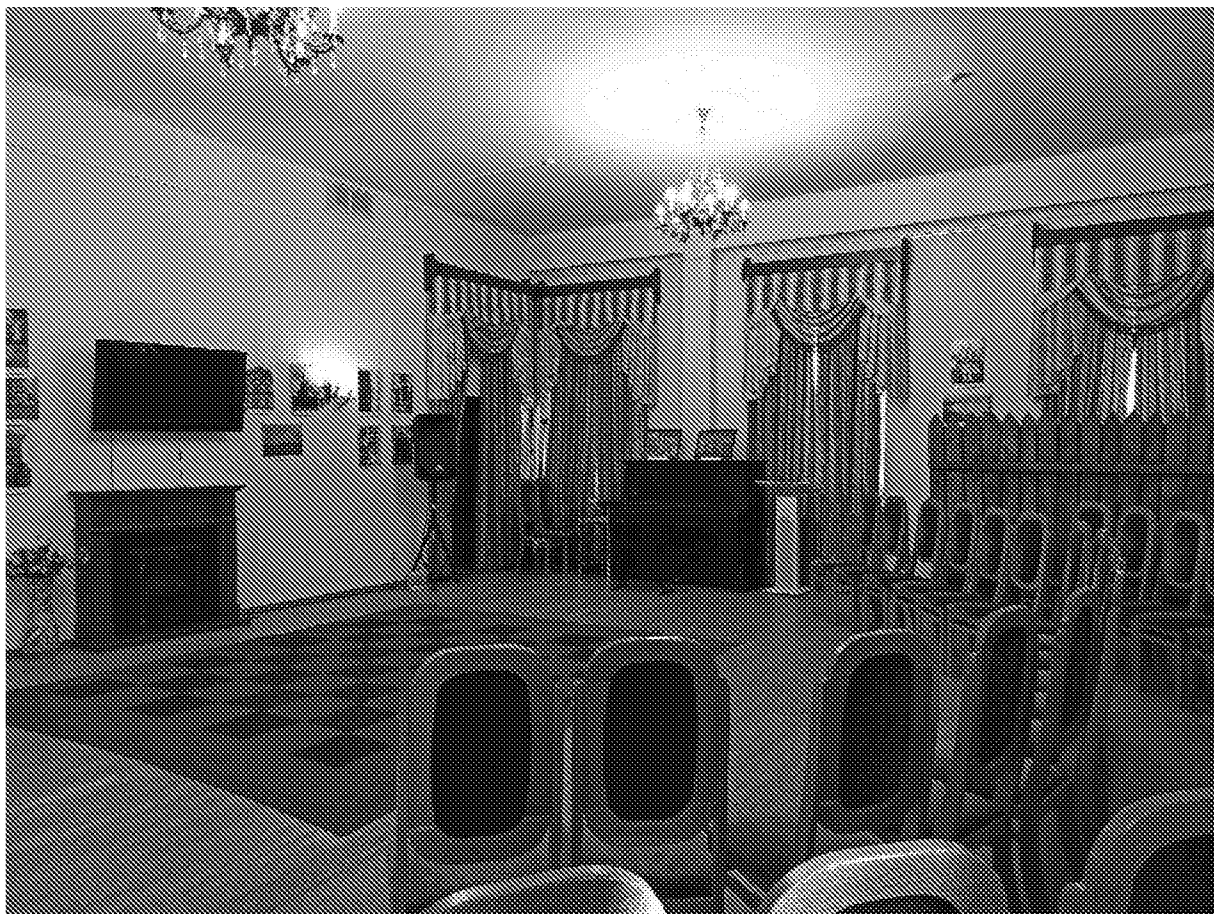
Фрагмент интерьера. Конференц - зал