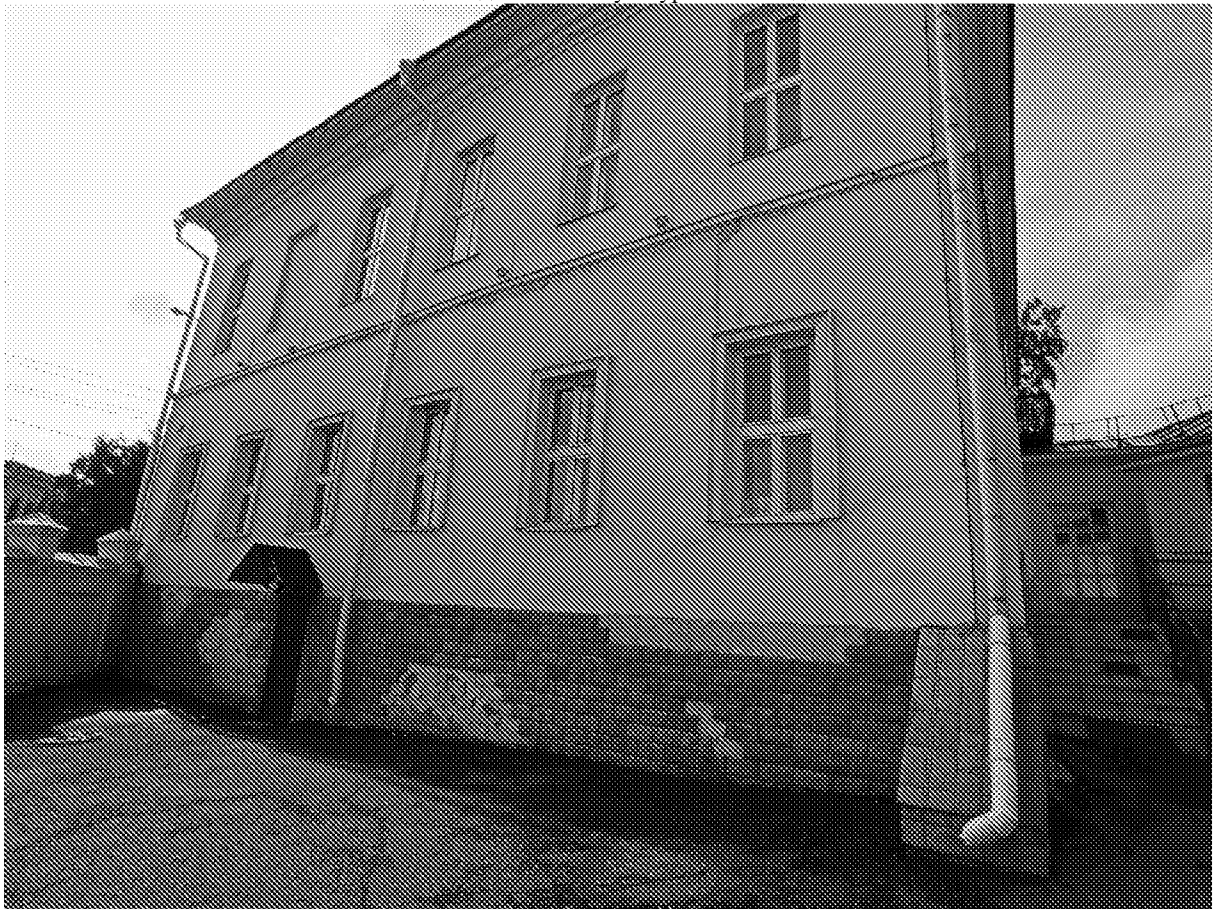
Вид на объект культурного наследия с восточной стороны