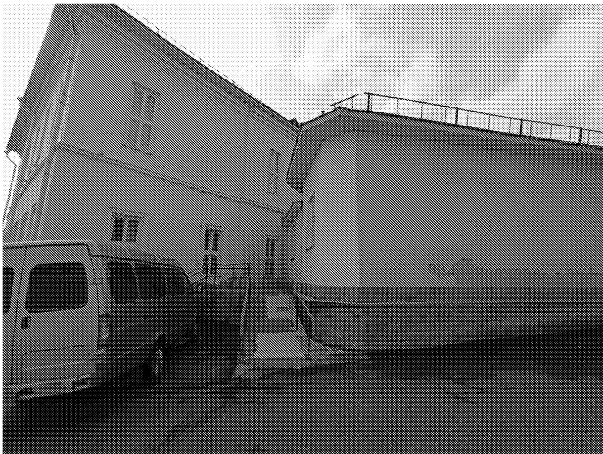
Вид на объект культурного наследия с северной стороны