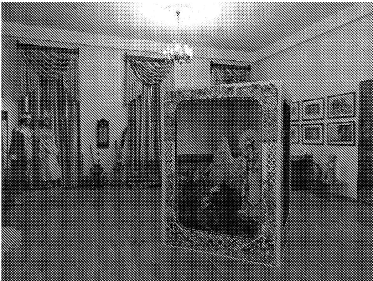
Фрагмент интерьера. Выставочный зал