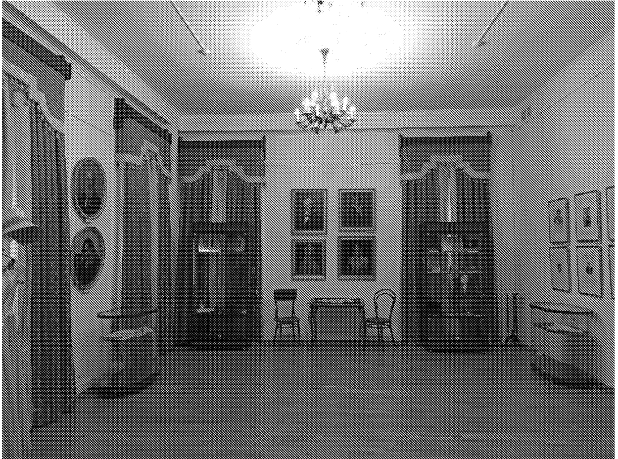
Вид помещения в здании музея