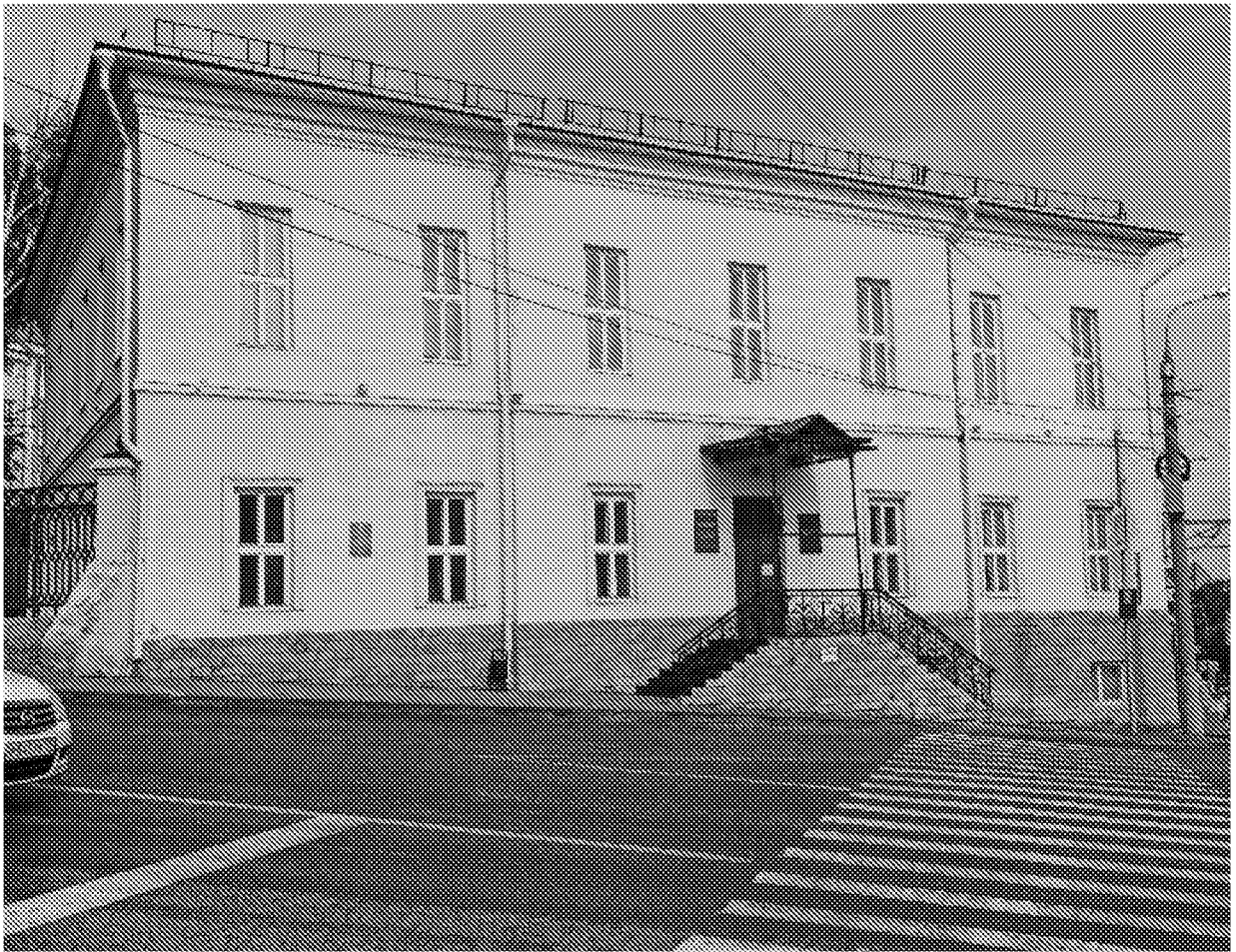
Общий вид на объект культурного наследия