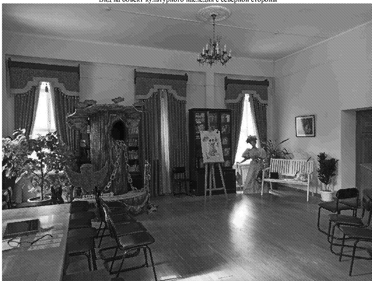
Вид помещения в здании музея