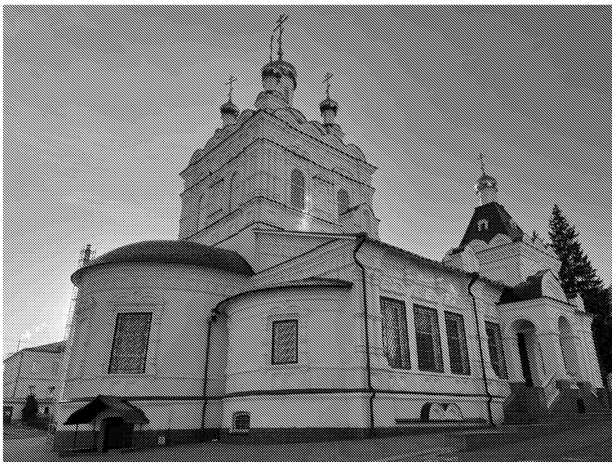
Вид на восточный и северный фасады монастыря (25.11.2021 г.)