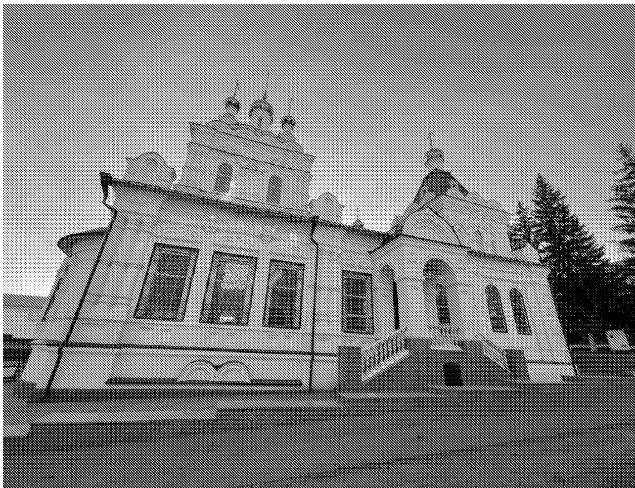
Северный фасад монастыря (25.11.2021 г.)