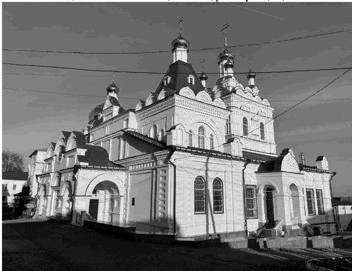
Вид на южный и западный фасады монастыря (25.11.2021 г.)