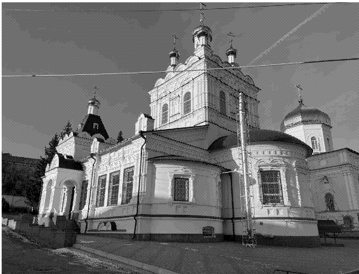
Вид на южный и восточный фасады монастыря (25.11.2021 г.)