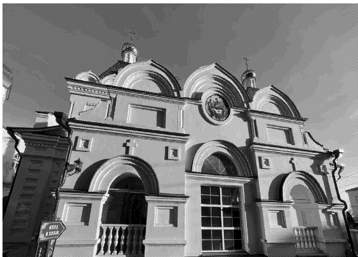
Западный фасад монастыря (25.11.2021 г.)