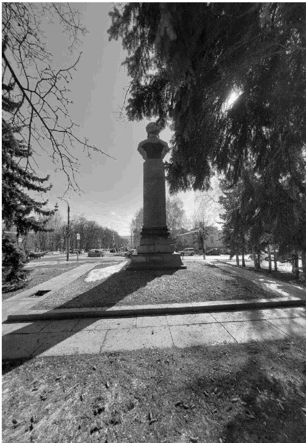
Вид на объект культурного наследия с западной стороны (11.04.2022 г.)