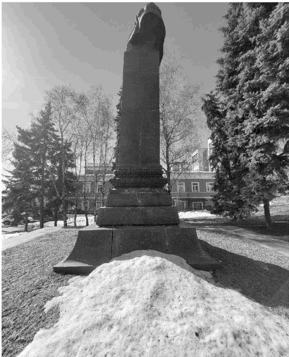
Вид на объект культурного наследия с южной стороны (11.04.2022 г.)