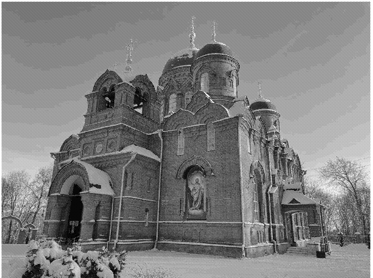
Юго-западный фасад собора (24.12.2021 г.)