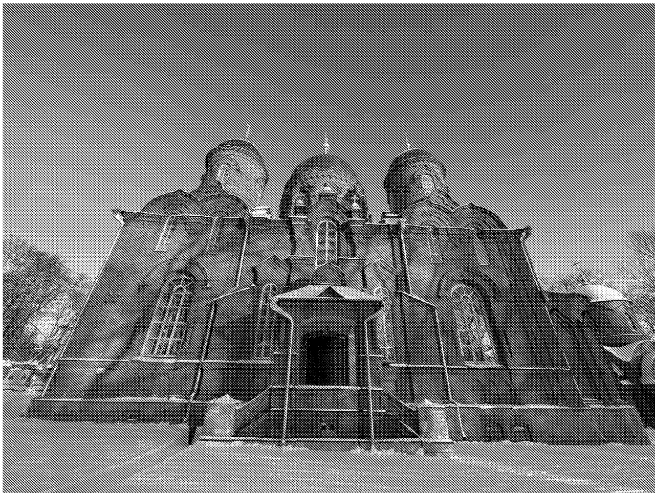
Южный фасад собора (24.12.2021 г.)