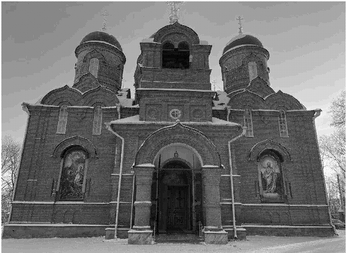
Западный фасад собора (колокольня и притвор) (24.12.2021 г.)