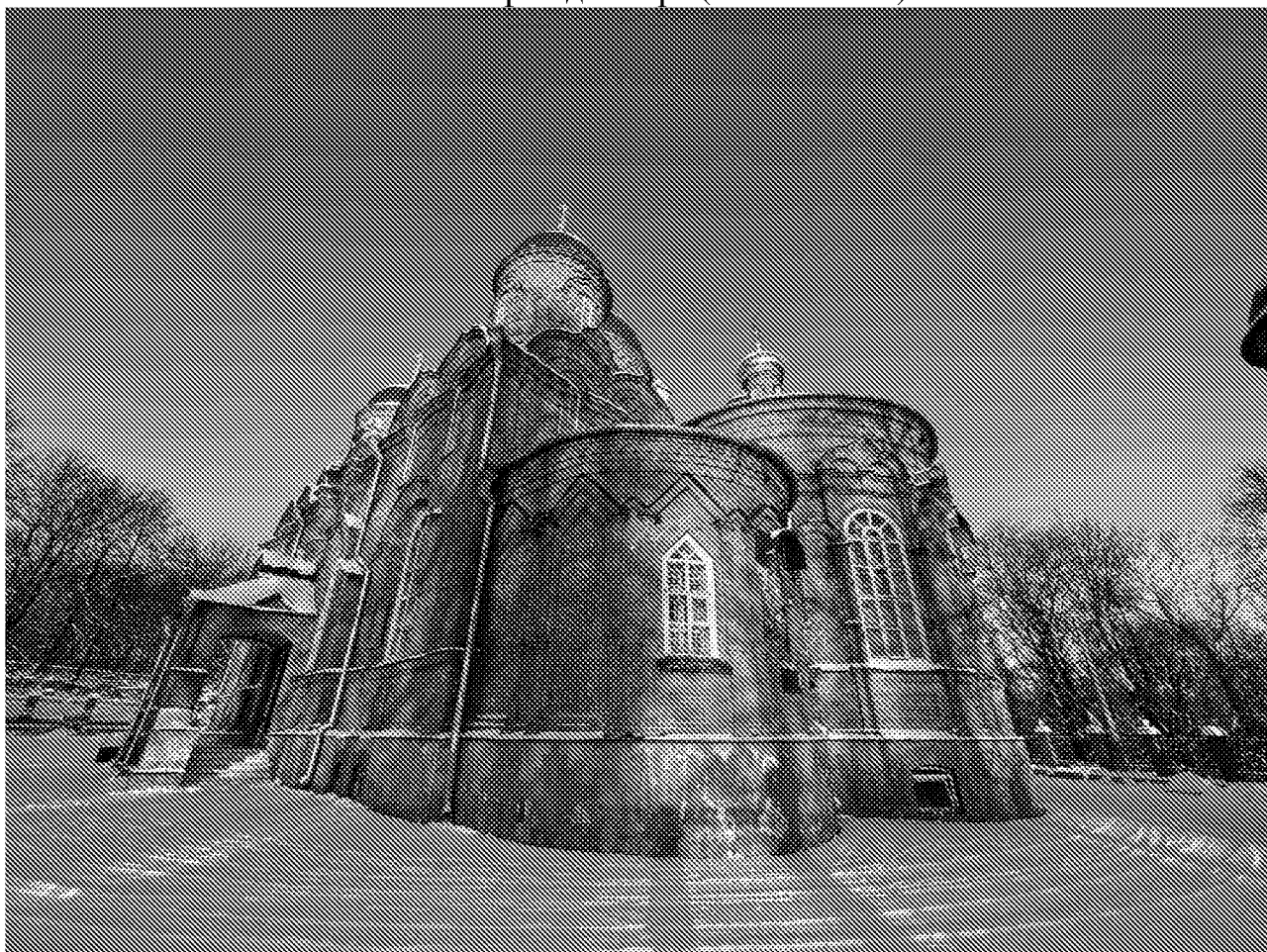
Юго-восточный фасад собора (24.12.2021 г.)