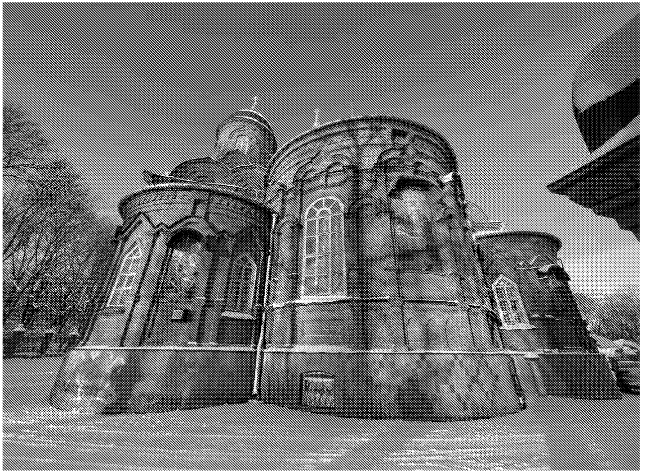
Восточный фасад собора (три апсиды) (24.12.2021 г.)