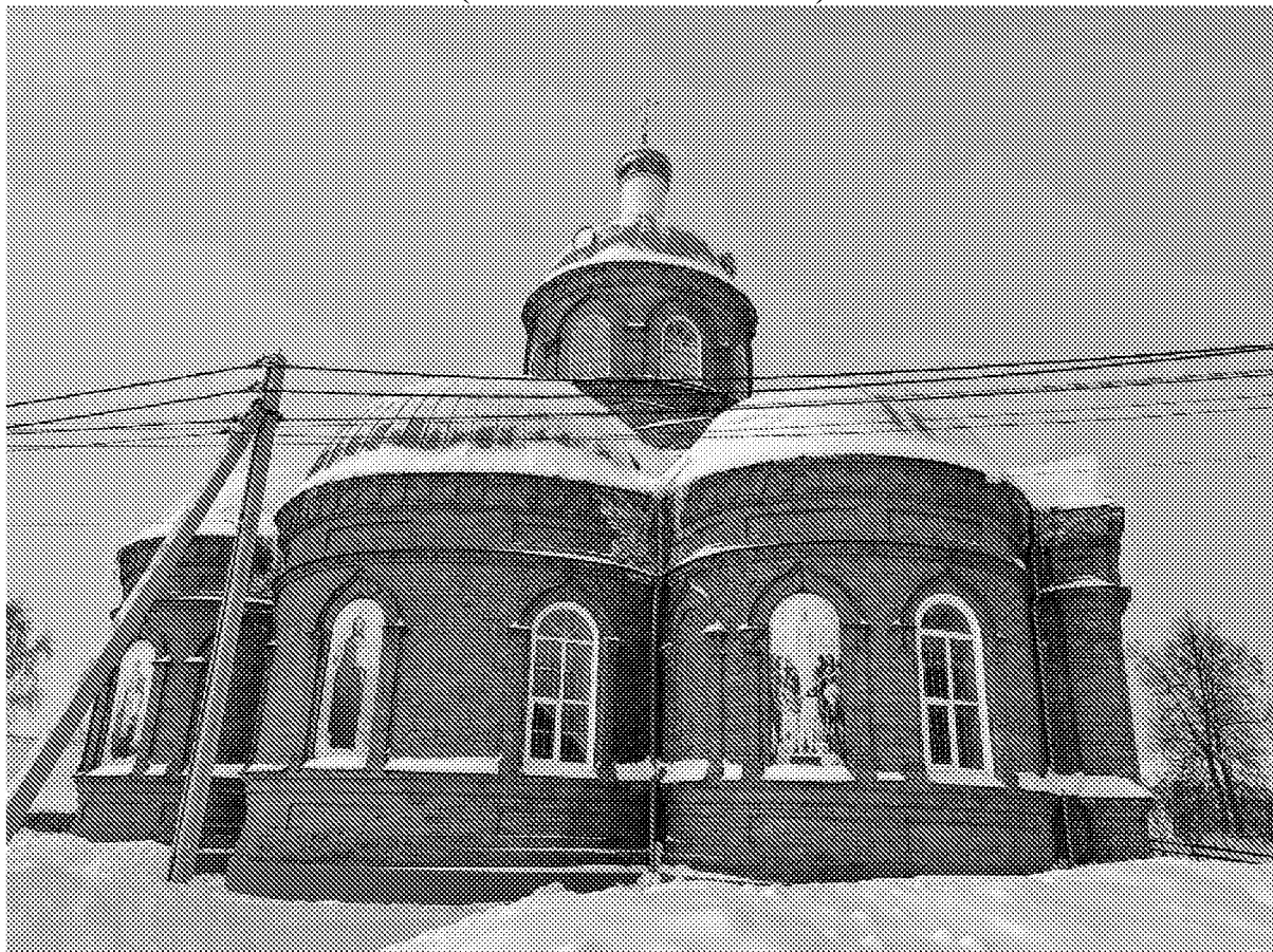
Восточный фасад храма (трехапсидный) (28.01.2022 г.)