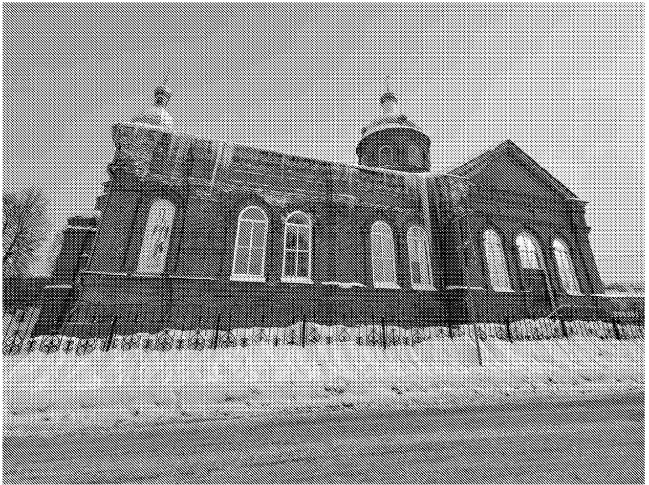
Южный фасад храма (28.01.2022 г.)