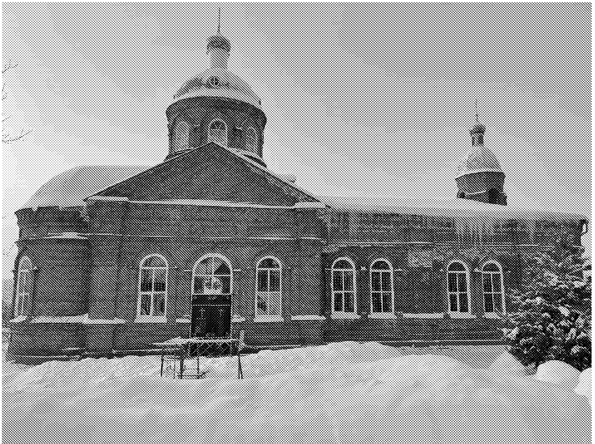
Северный фасад храма (28.01.2022 г.)