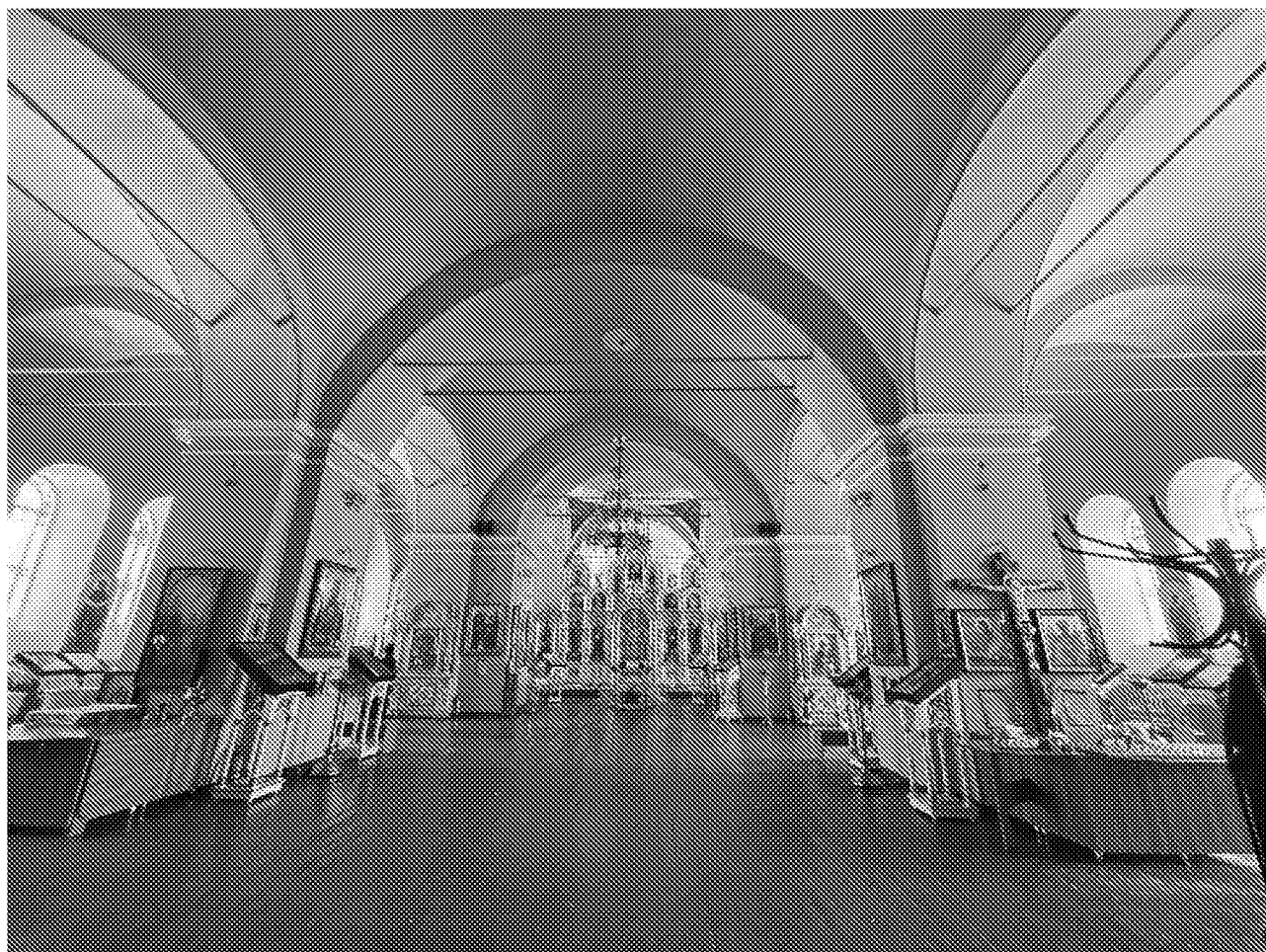
Интерьер (трапезная) (28.01.2022 г.)