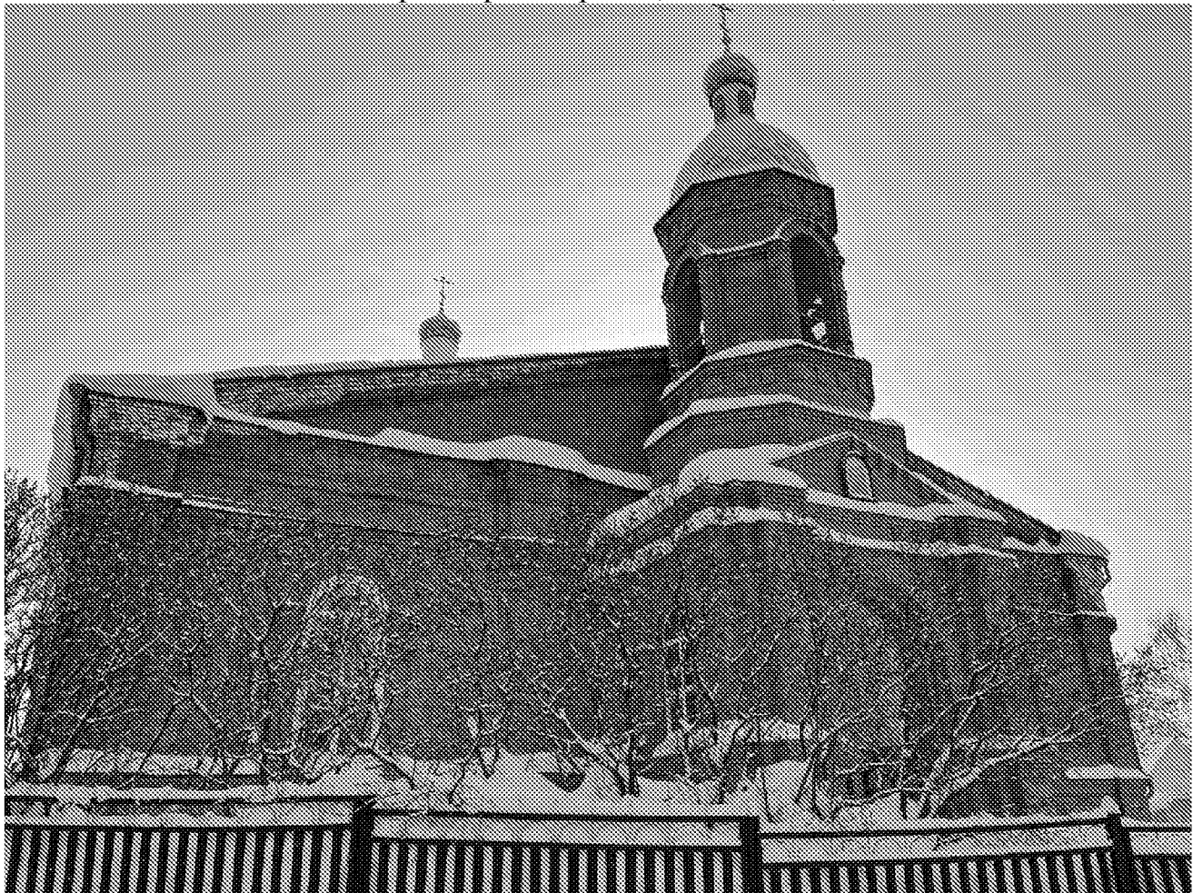
Западный фасад храма (28.01.2022 г.)