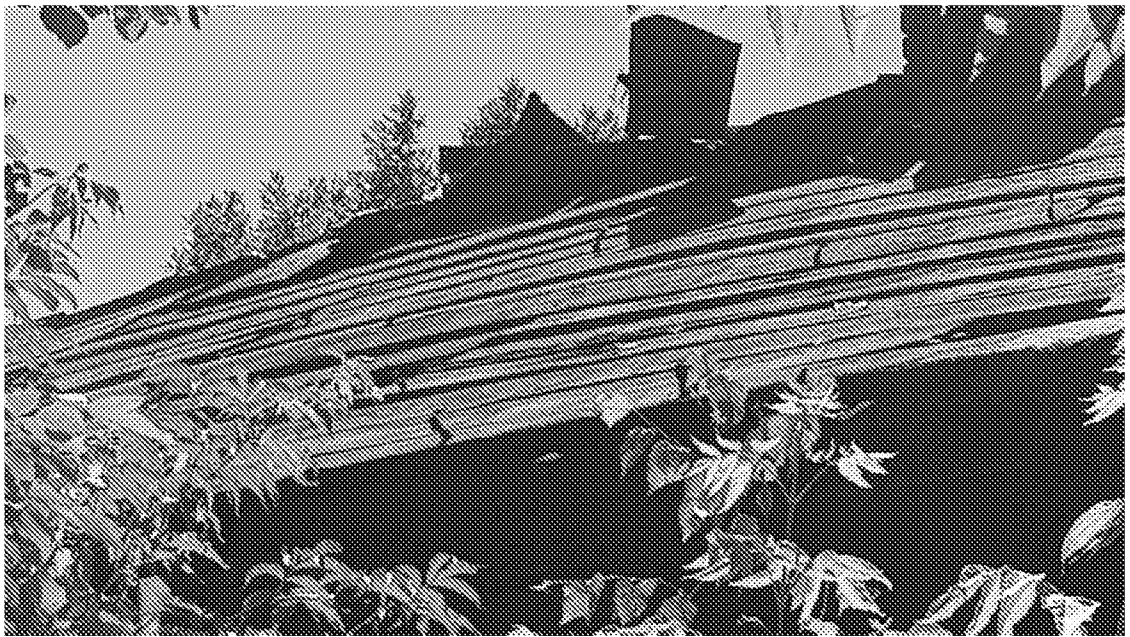
Вид на крышу объекта культурного наследия с северной стороны (27.06.2022)