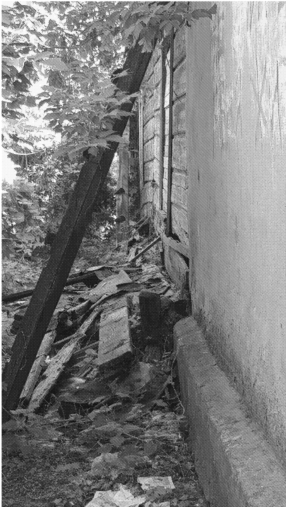
Вид на объект культурного наследия с северной стороны. (27.06.2022)