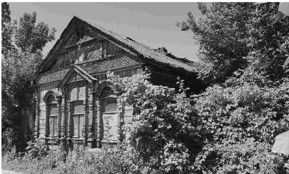
Вид на объект культурного наследия с северо-восточной стороны (27.06.2022)