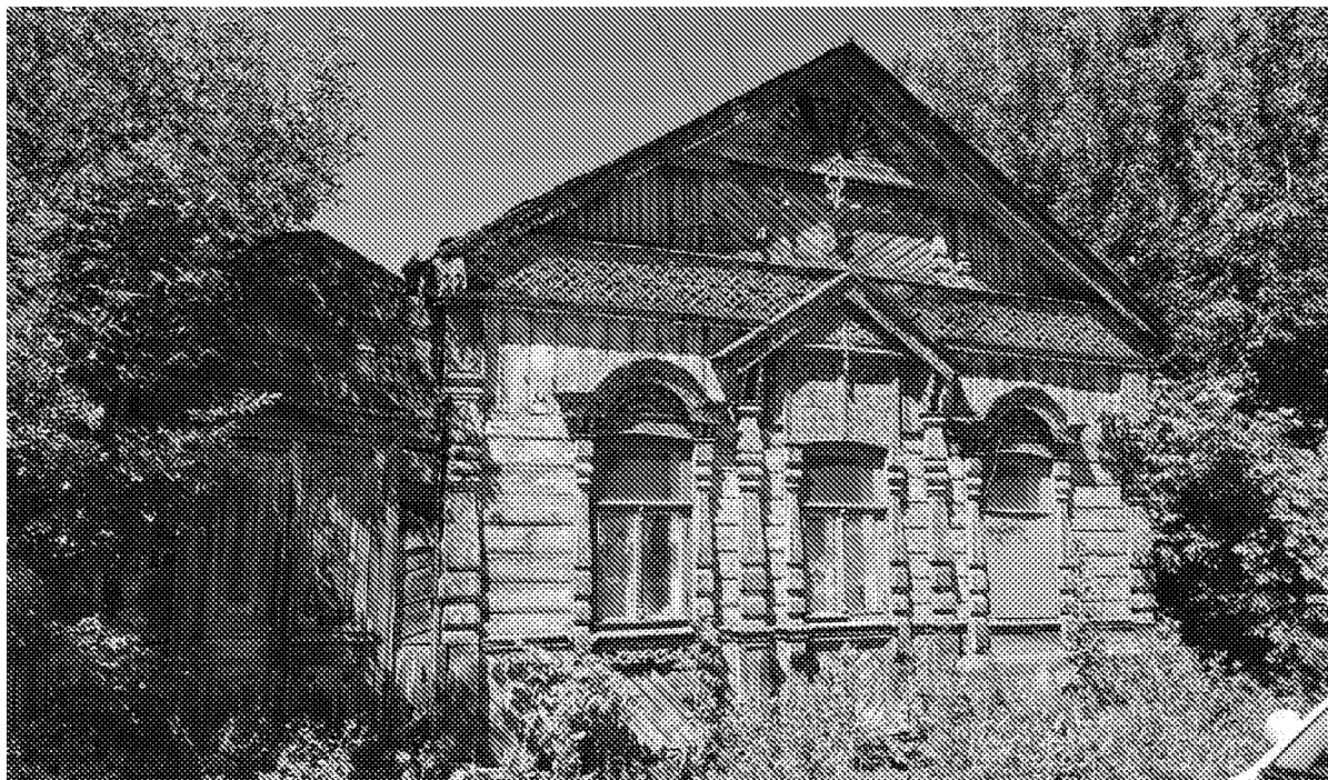
Вид на объект культурного наследия с восточной стороны (27.06.2022)