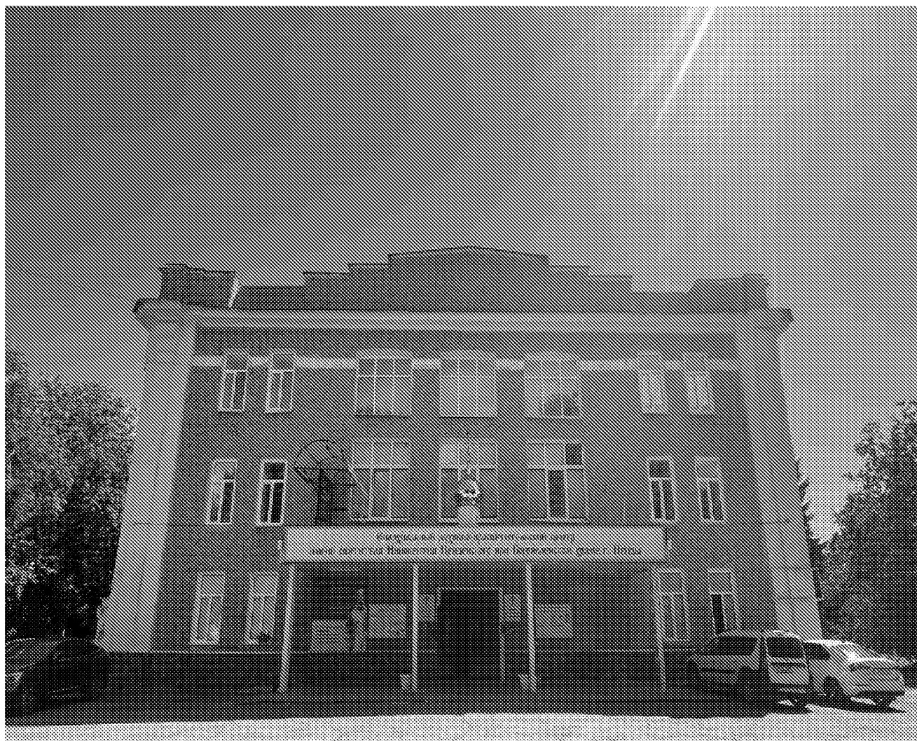
Главный (западный) фасад объекта культурного наследия