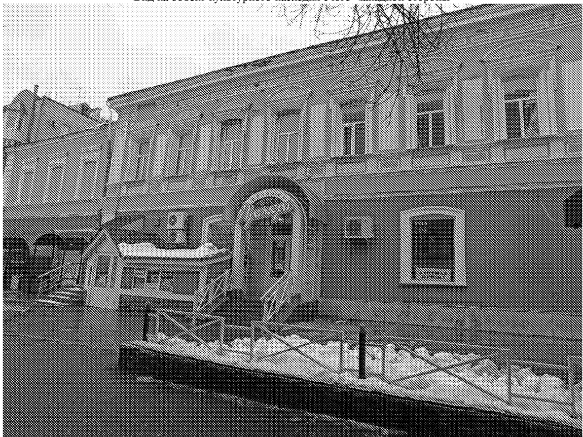
Вид на объект культурного наследия с северной стороны