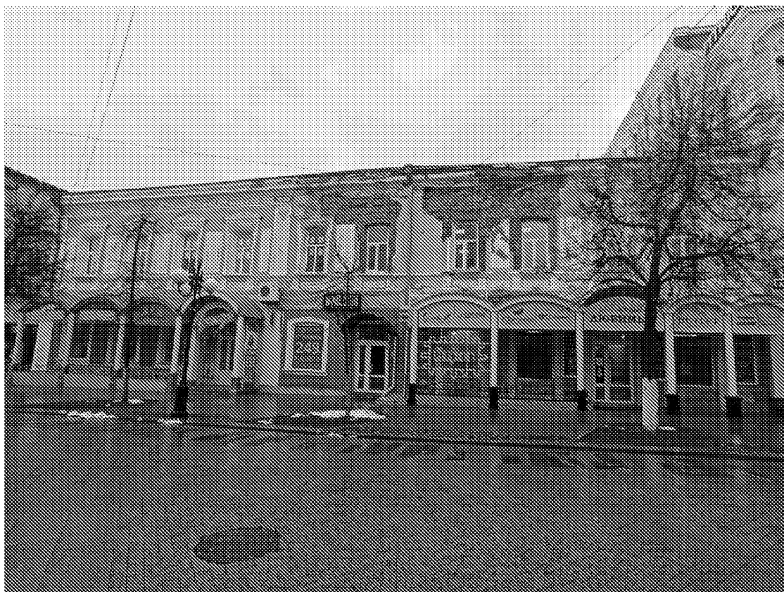
Вид на объект культурного наследия с западной стороны . Главный фасад.