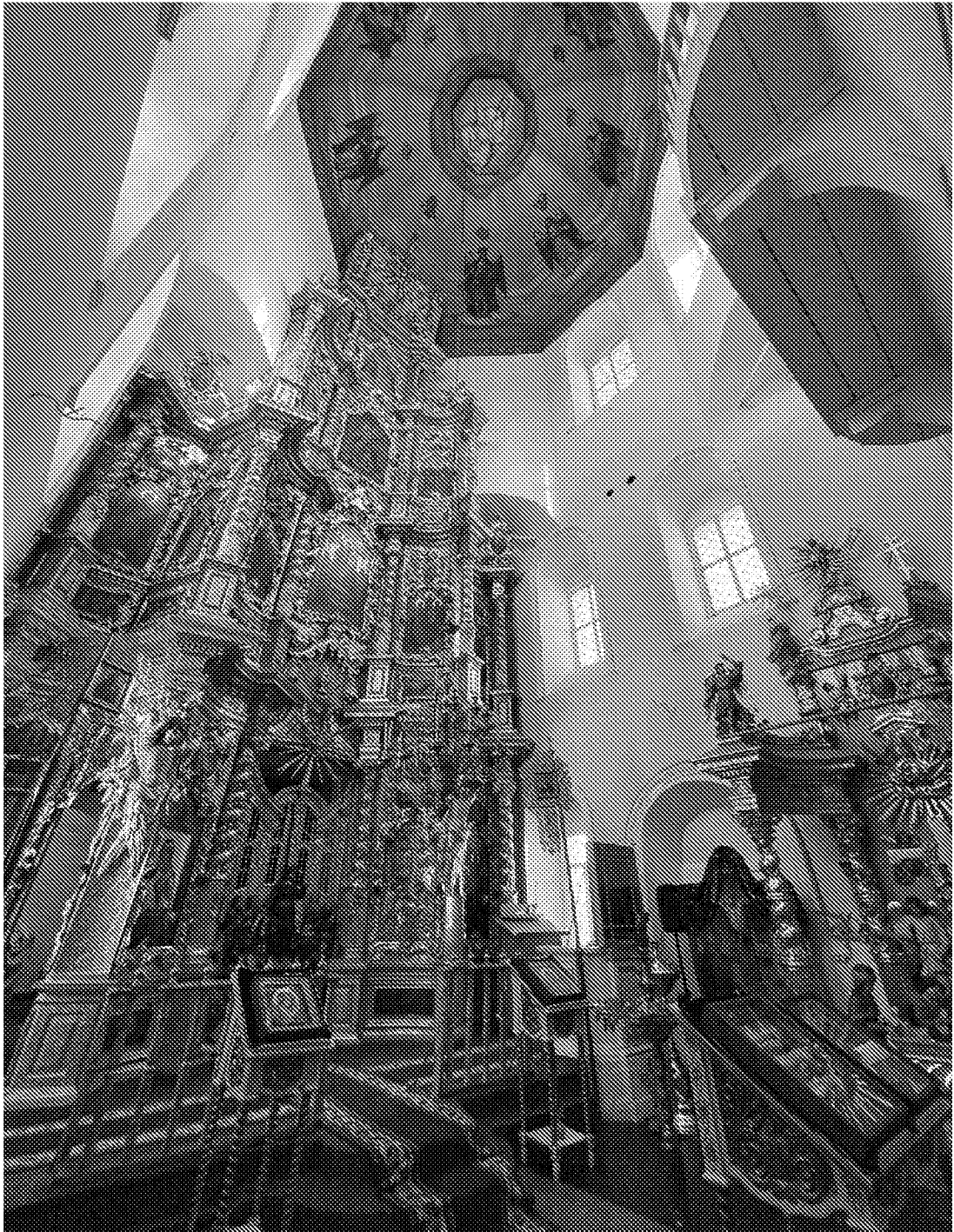
Фрагмент интерьера. Летняя церковь. Наос. Иконостас