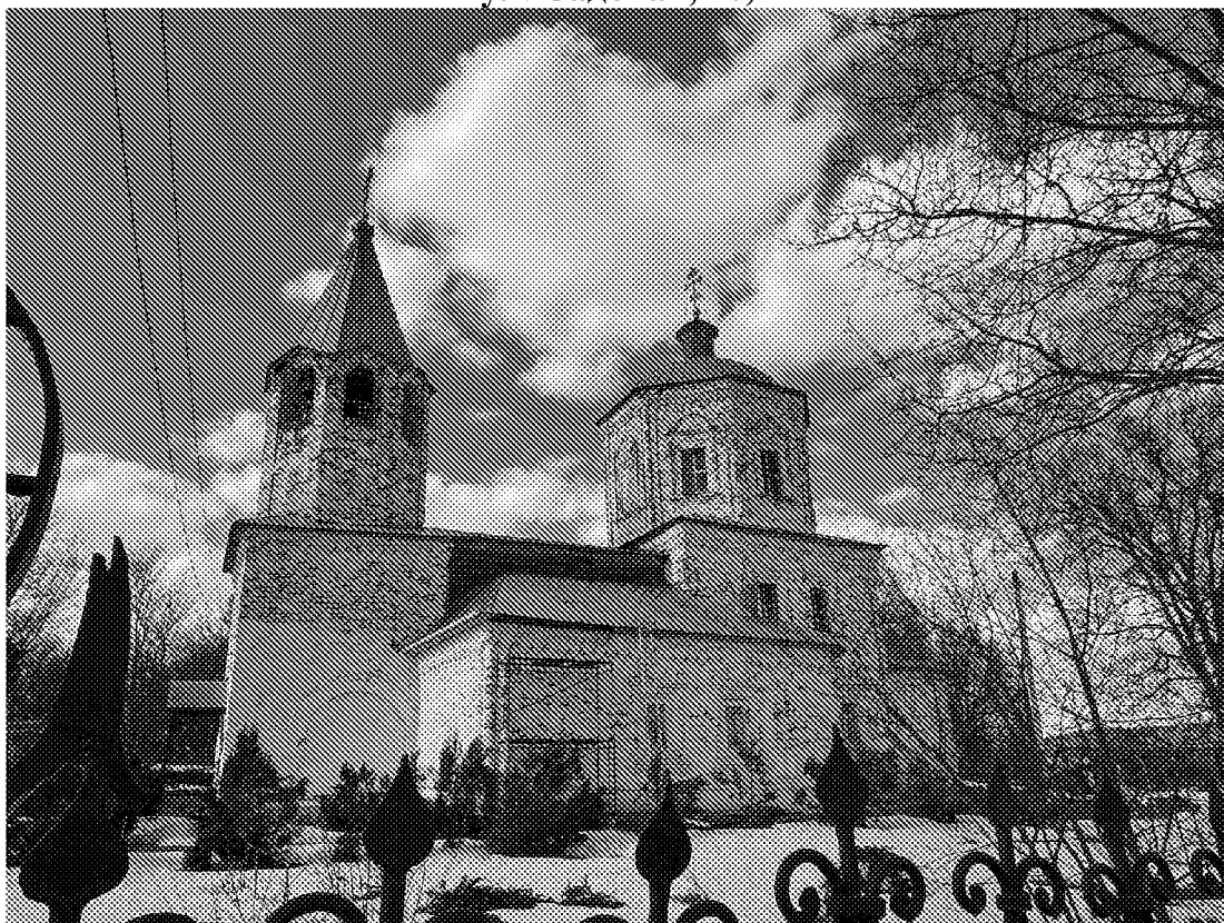
Общий вид объекта культурного наследия. Южный фасад