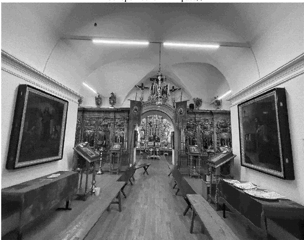
Фрагмент интерьера (трапезная). Зимняя церковь