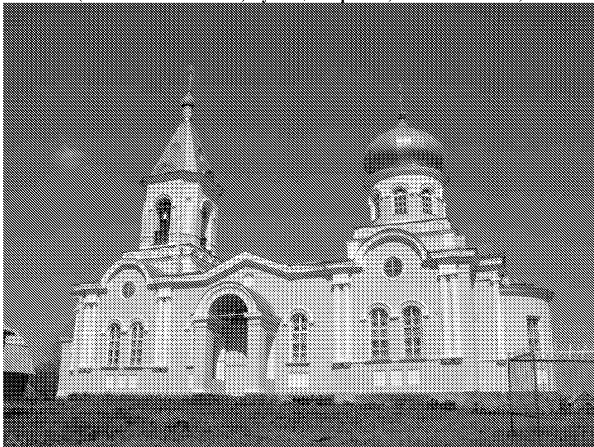
Общий вид на объект культурного наследия